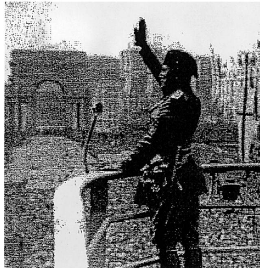
Abbildung 2. Die Übereinstimmung ist offensichtlich – doch wer hat da wen kopiert? Und wie steht es mit dem Kopierrecht? Globi-Ausschnitt aus der Jugendzeitschrift «Der Globi», Jg. 5, 1939, S. 58; der Duce aus verschiedenen anderen, zum Teil auch elektronisch abrufbaren Bildern.

suggeriert hat? Und wird das eine Bild (Nr. 4) «harmloser» oder wird es nicht sogar problematischer, gerade weil es verpackt in einem scheinbar «harmlosen» Kontext daherkommt?