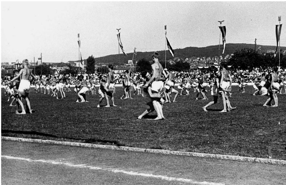
Abbildung 3. Freistilringen der Jugendlichen beim RDJ-Sportfest. Im Hintergrund sind die weithin sichtbaren Flaggen des nationalsozialistischen Deutschland und des faschistischen Italien zu sehen (BAR, E 4320 (B) 1968/195, Bd. 33: C. 2. 51, Bericht der Stadtpolizei Zürich vom 6. 7. 1942).