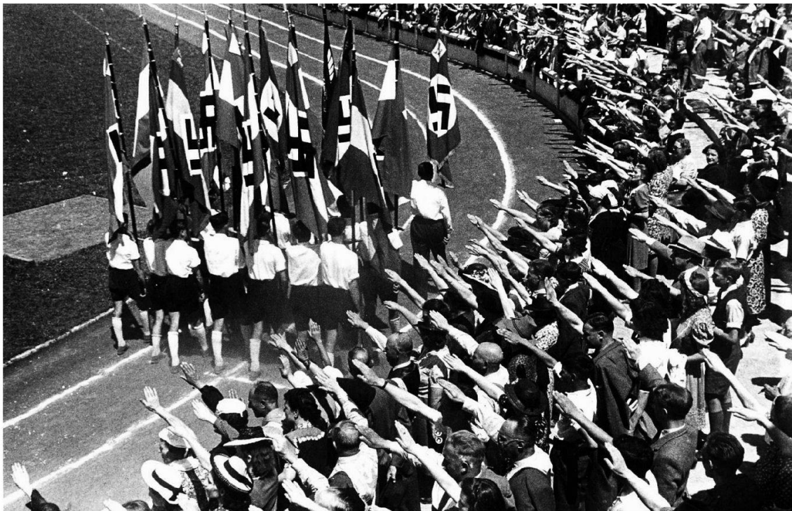
Abbildung 4. Einmarsch der RDJ-Sportler beim Sportfest, von den Zuschauerinnen und Zuschauern mit dem Hitler-Gruss begrüsst (BAR, E 4320 (B) 1968/195, Bd. 33: C. 2. 51, Bericht der Stadtpolizei Zürich vom 6. 7. 1942).

das Symbol der deutschen Sportgruppen mit Adler, Hakenkreuz, Schwert und Hammer (Abb. 5 und 6). Aus Beschwerden können wir schliessen, dass die Jugendlichen bei der Anreise Hakenkreuzfähnchen mit sich führten, die sie auch aus den Fenstern der Eisenbahnabteile hinaushielten. Eine offizielle Reaktion darauf ist nicht bekannt. Hingegen nahm die Polizei einen «linksextremen Schmierer» fest, der auf die Plakate, mit denen das Sportfest angekündigt worden war, «kommunistische Parolen» gemalt hatte. Bei Hakenkreuzen waren die Begriffe «Not», «Hunger», «Krieg» hinzugefügt worden, bei Hammer und Sichel standen «Brot», «Arbeitsglück», «Frieden» 17 (Abb. 7–9). Insgesamt war das Sportfest eine erfolgreiche faschistische Werbeveranstaltung mitten in der – offiziell neutralen – Schweiz.