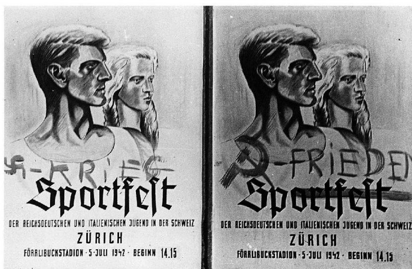
Abbildungen 7–9. Die «Schmieraktion»: Eine Plakatwand bei der städtischen Polizeiwache in der Limmatstrasse, Zürich 5, anlässlich des RDJ-Sportfestes (BAR, E 4320 (B) 1968/195, Bd. 33: C. 2. 51, Bericht der Stadtpolizei Zürich vom 6. 7. 1942).