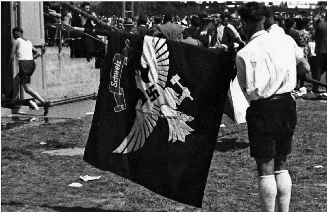
Abbildung 6. Die Landesfahne Schweiz der nationalsozialistischen Sportgruppen beim Zürcher Sportfest.