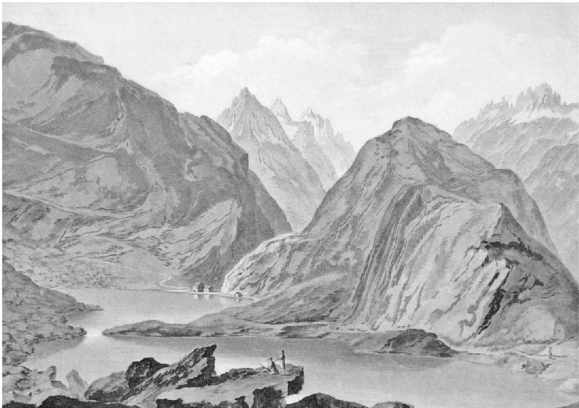
Abbildung 1. Grimselsee und Hospiz 1783, gemäss einem Bild von Caspar Wolf (Alpines Museum der Schweiz, Bern).

liser. Im Laufe der Zeiten zogen sich diese immer mehr zurück, sodass sich schliesslich die Territorialgrenze zwischen Bern und dem Wallis auf der Passhöhe ausbildete.