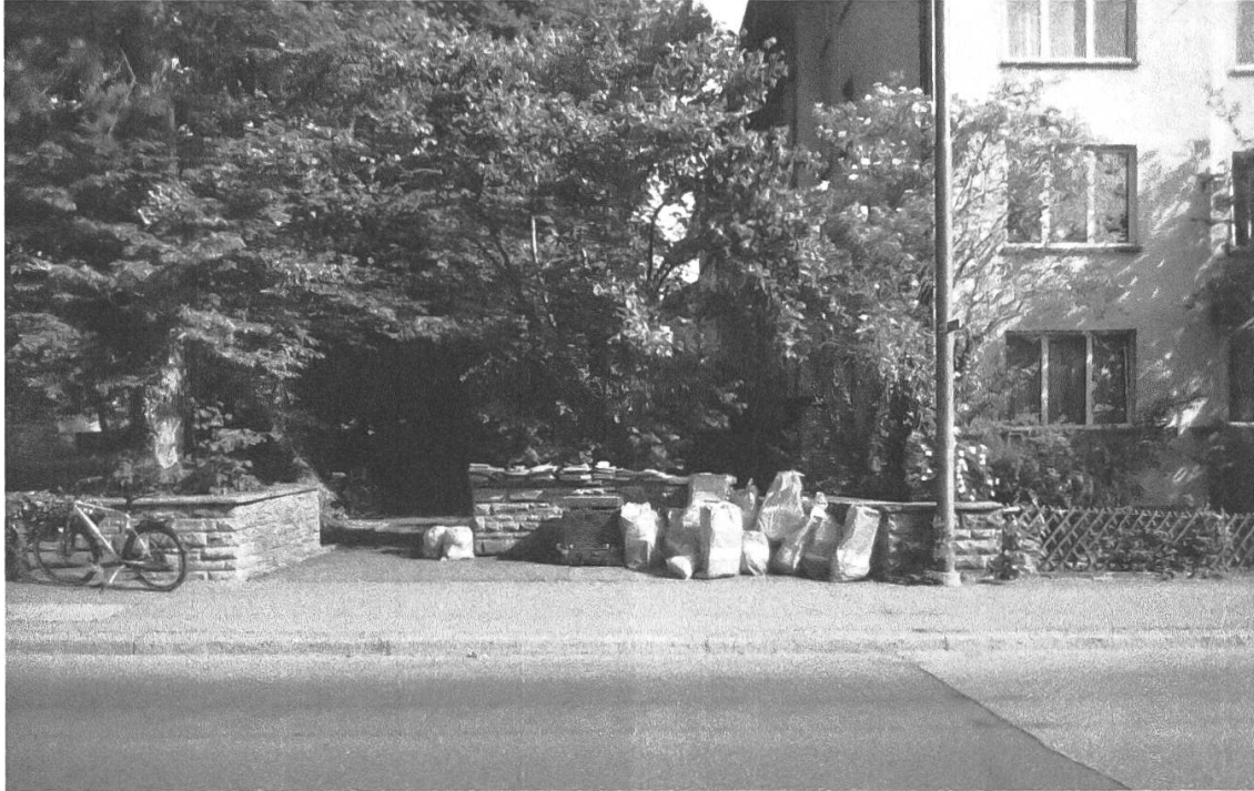
Abb. 1: Fundstelle des Jegerlehner-Nachlasses: Schosshaldenquartier in Bern, 24.5.20.