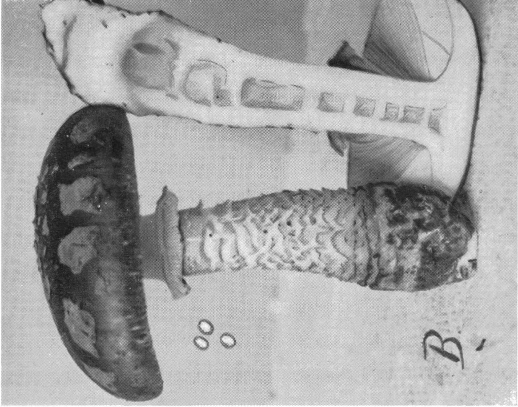
Amanita cariosa Fr., Zellighohler Wulstling