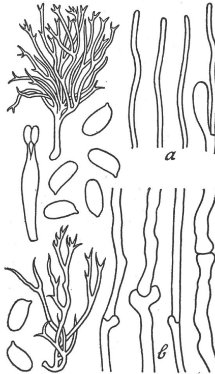
Fig. 2 – Lentaria delicata – Carpophores gr.nat. Basides \times 500 . Spores \times 1000 . a: Poils de la pubescence des rameaux \times 500 . b: Hyphes de la chair \times 500 .

Spores hyalines-incolors, lisses, sans guttule, elliptiques-cylindriques, à apicule petit déjeté latéralement. Basides bisporiques, parfois monosporiques, claviformes allongées, 33-35 \times 6-7 \mu , sans les stérigmates qui mesurent à peu près 5 ou 6 \mu . Hyménium entremêlé de poils disséminés, grêles et longs, de 2-2,5 \mu de diamètre et saillant de 20-30 \mu sur l'hyménium. L'extrémité des rameaux est stérile, pubescente par des poils de même nature que les précédents, sauf à son extrême pointe qui est glabre et formée d'un tissu d'hyphes couchées de même diamètre que ces poils. Chair à hyphes toutes à paroi mince et jamais épaissie, même dans le tronc, droites ou ondulées, bouclées, atteignant 7 à 8 \mu de diamètre.