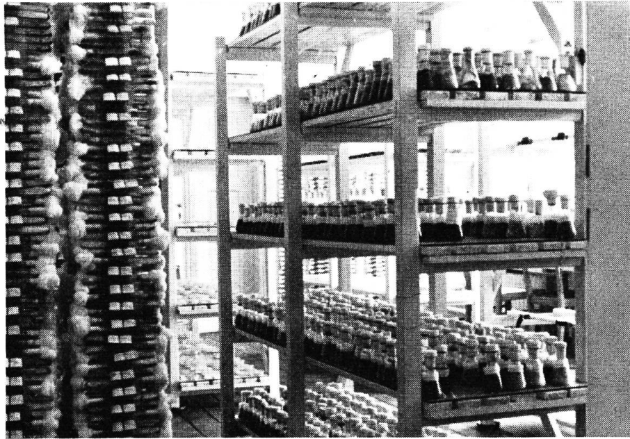
Blick in einen der Kulturräume

Benden Stopfen alle 3–4 Monate auf frische Nährböden überimpften und jeden Stamm stets 6fach halten, wobei für die Überimpfung jeweils die am besten gewachsene Kultur verwendet wird. Es findet so eine ständige Auslese statt. Aus diesen Stammkulturen impfen wir dann z. B. für Untersuchungen hinsichtlich antagonistischen Verhaltens der verschiedenen Pilzarten verpilzte Agarteile auf Nährböden in Petrischalen. Werden jeweils 2 verschiedene Pilzarten in eine Petrischale geimpft, läßt sich sehr gut beobachten, ob und wie stark eine Pilzpflanze die andere in ihrer Entwicklung hemmt. Aus diesem antagonistischen Verhalten lassen sich mancherlei Schlüsse hinsichtlich der Bildung von Wirkstoffen ziehen. Auch zur Vergesellschaftung verschiedener Pilzarten zeigen diese Arbeiten interessante Parallelen. Die biologische Wirksamkeit der ausgeschiedenen Wirkstoffe wird in Kulturversuchen mit höheren Pflanzen geprüft.