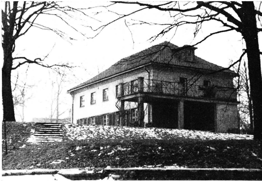
Gebäude der Abteilung für angewandte Pilzkunde

blätter. Am Beobachtungsort wird die Begleitflora der Pilze, der Boden und das Substrat möglichst eingehend untersucht, beschrieben und die zur Zeit der Beobachtung am Standort vorhandene Luft- und Bodenfeuchtigkeit sowie die Temperatur gemessen. Auch wird die Lichtintensität prozentual durch Vergleiche der Lichtverhältnisse am Standort und unter freiem Himmel zur gleichen Tageszeit erfaßt. Zur Messung dienen fotoelektrische Zellen. Die Fruchtkörper der Pilze werden mehrmals farbig unmittelbar am Standort fotografiert und unterhalb der Fruchtkörper Bodenproben entnommen.