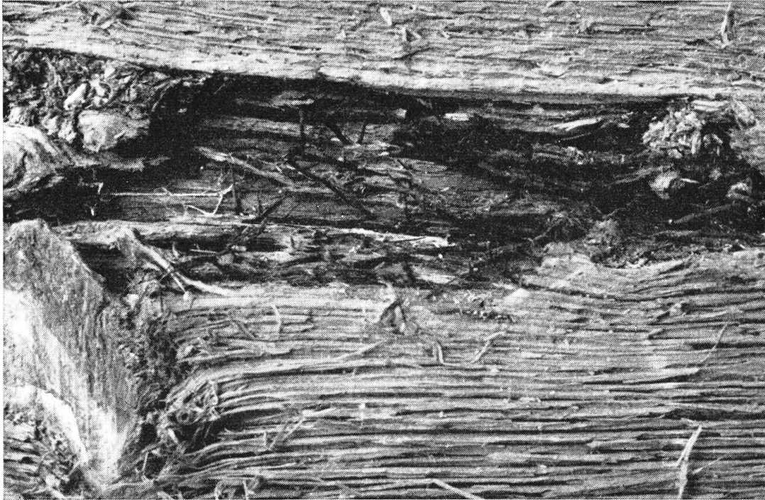
Vom Hallimasch zerstörtes Brett