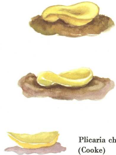
Plicaria chrysopela (Cooke)