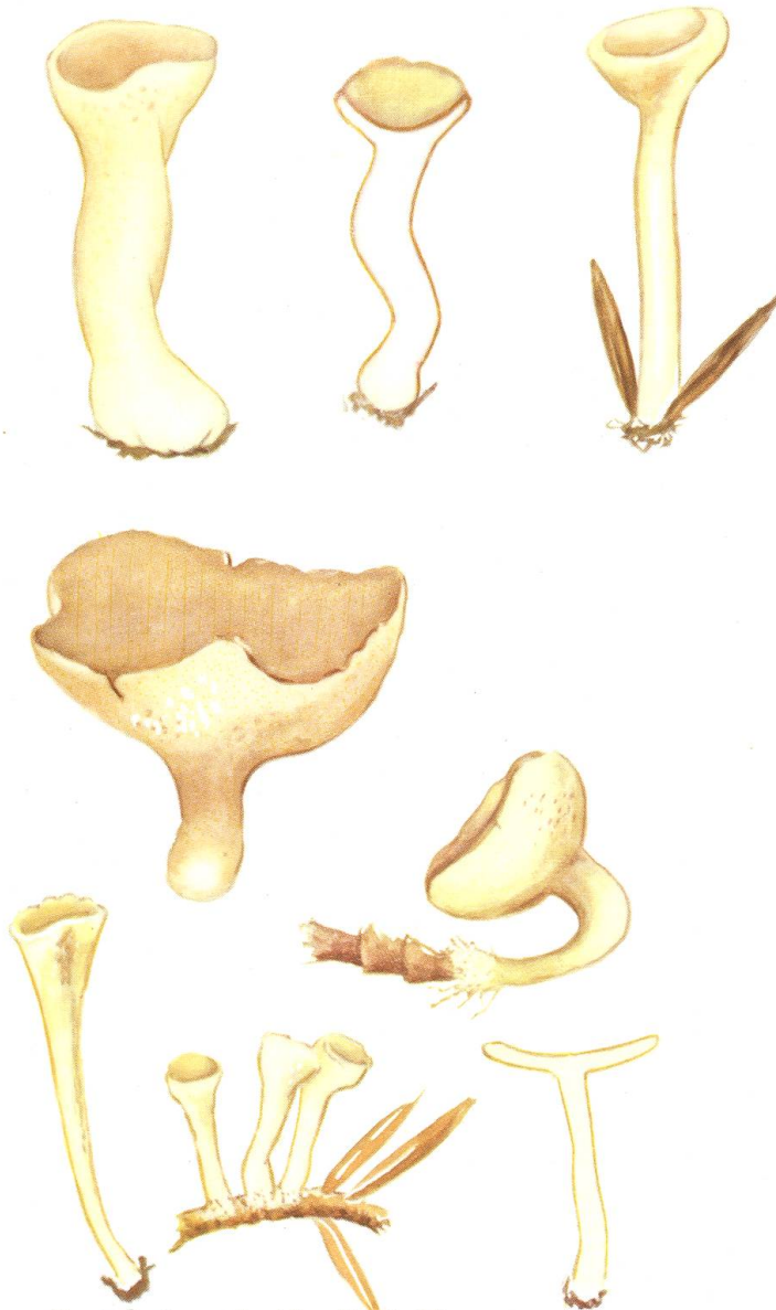
Pustularia catinoides Fuckel? Pustularia sibirica (Karsten)