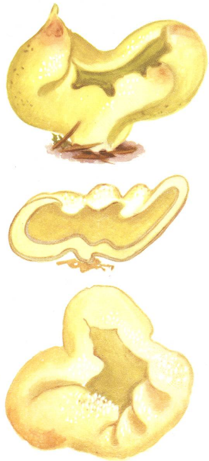
Galactinea sulphurea nov. sp.?