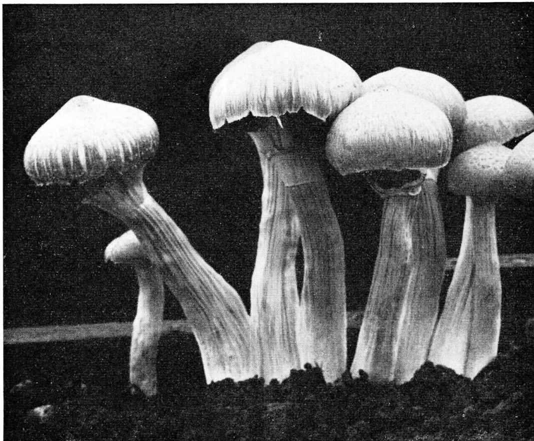
Psilocybe cubensis , aus einem Warmhaus in Pennsylvania in künstlicher Kultur.