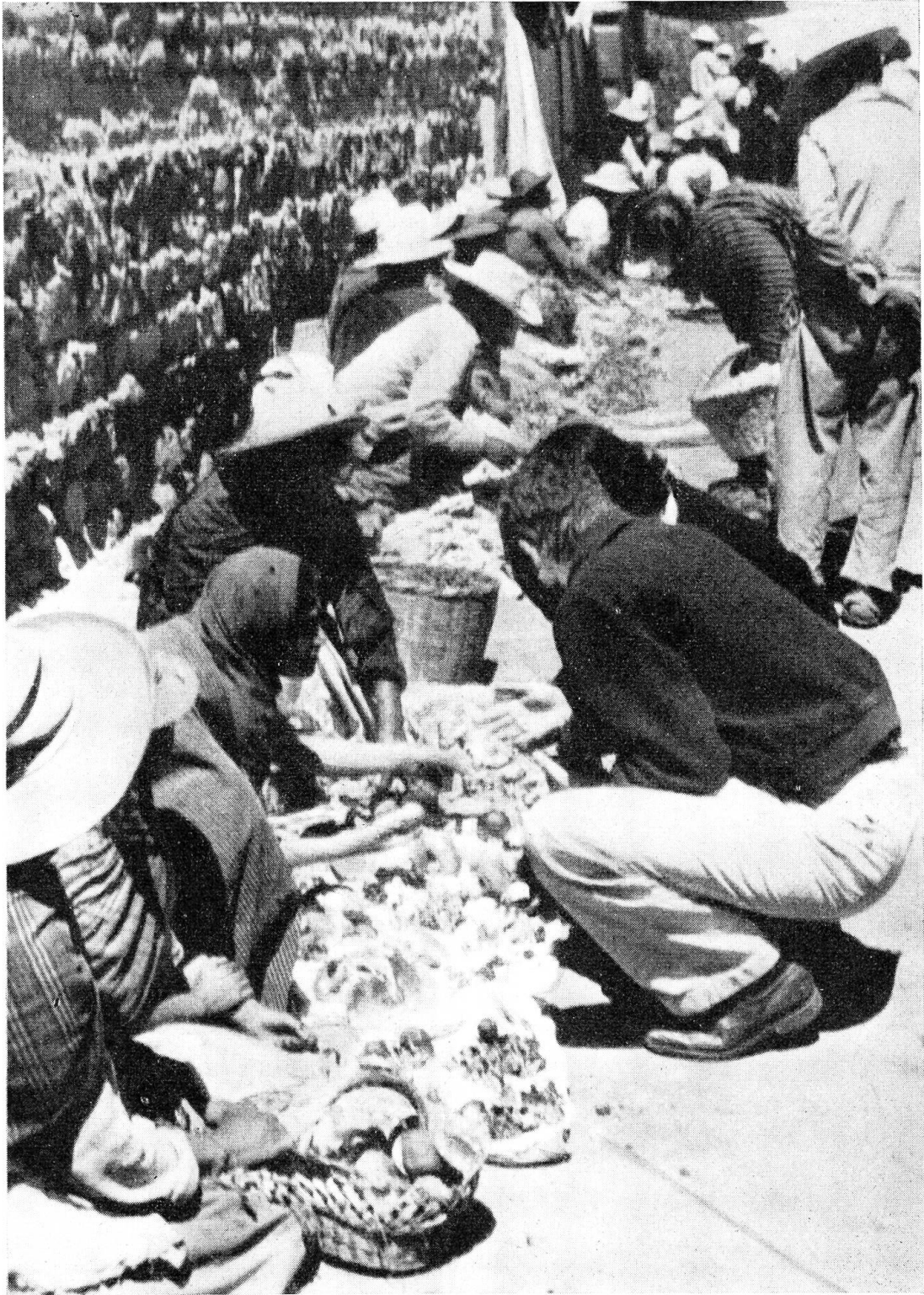
«Pilzsammeln» auf dem Markt von Tenango del Valle, Mexiko.