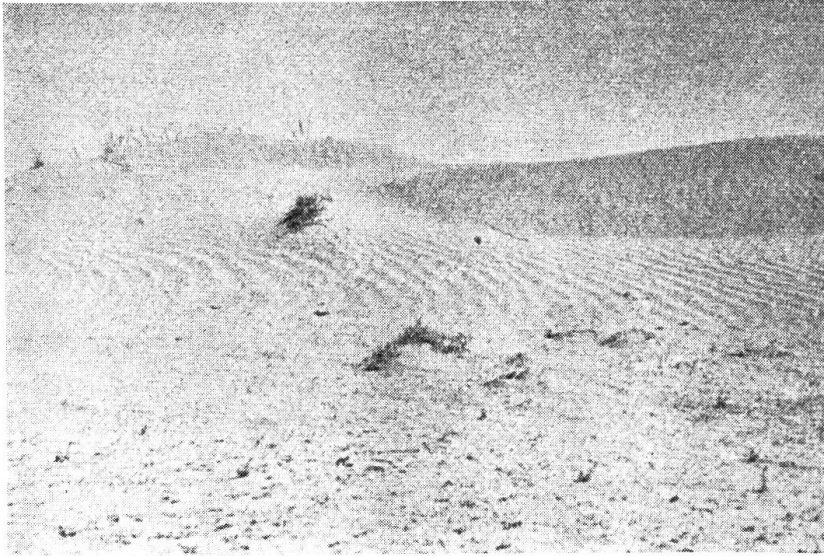
Halbwüste, etwa 30 Kilometer nördlich des Flusses Amu-Darja, wo der Bauchpilz Podaxis pistillaris (L. ex Fr.) Morse gefunden wurde