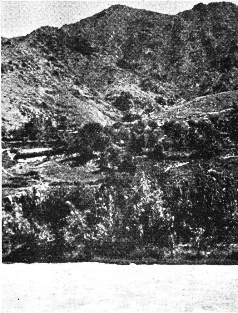
Tal des Flusses Warsob, nördlich von Düschembe, Tadschikische SSR

aufweist, kann man damit rechnen, daß in absehbarer Zeit hier ein großes Industriegebiet entstehen wird. Das Gebirge ist sehr reich an Mineralschätzen, die ausgenutzt werden können.