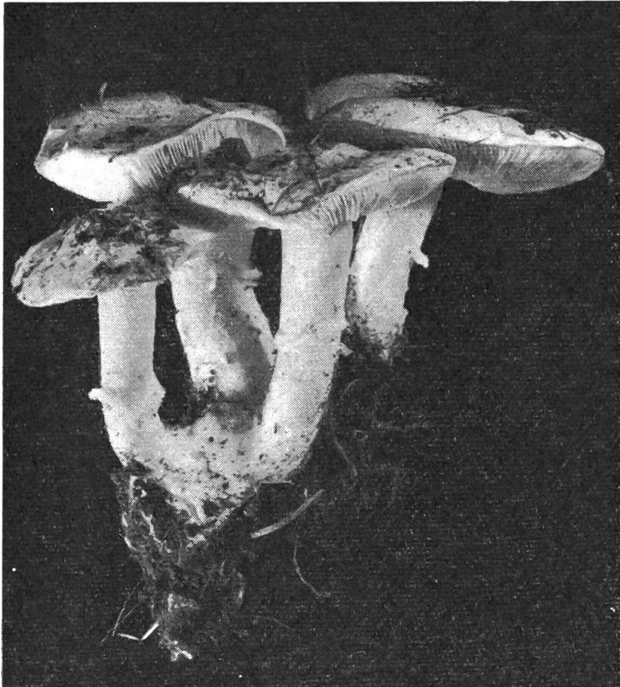
Calocybe constricta (Fr.) Sing.: Fruchtkörperbüschel. (Prag, Petřín Park, 25.10.1967.)