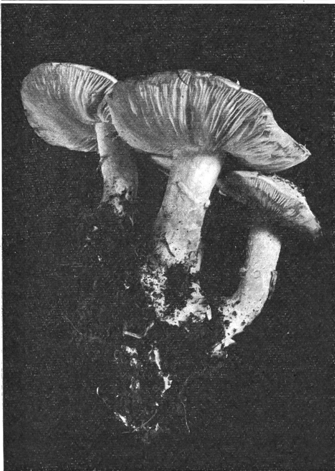
Calocybe constricta (Fr.) Sing.: Fruchtkörper von der Unterseite. (Prag, Petřín Park, 25.10.1967.)