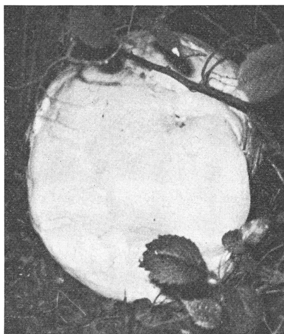
Links: Querschnitt (schematisch) durch einen Riesenbovist ( Calvatia maxima ). a) Fertiler Teil (Gleba), basidienführendes Gewebe; b) innere Hülle (Endoperidie); c) äussere Hülle (Exoperidie). – Rechts: Fruchtkörper des enormen Riesenbovists ( Calvatia maxima ). \frac{1}{9} natürliche Grösse.