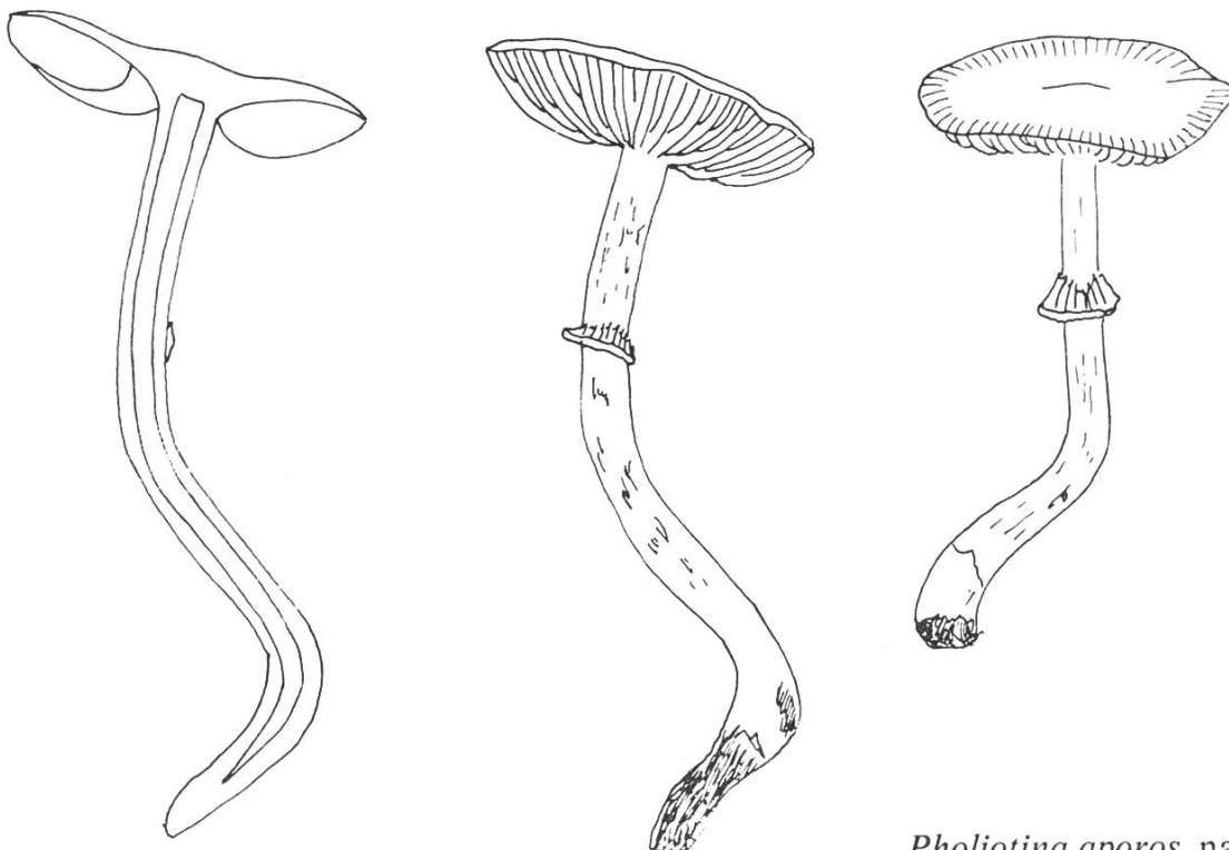
Pholiotina aporos , natürliche Grösse.