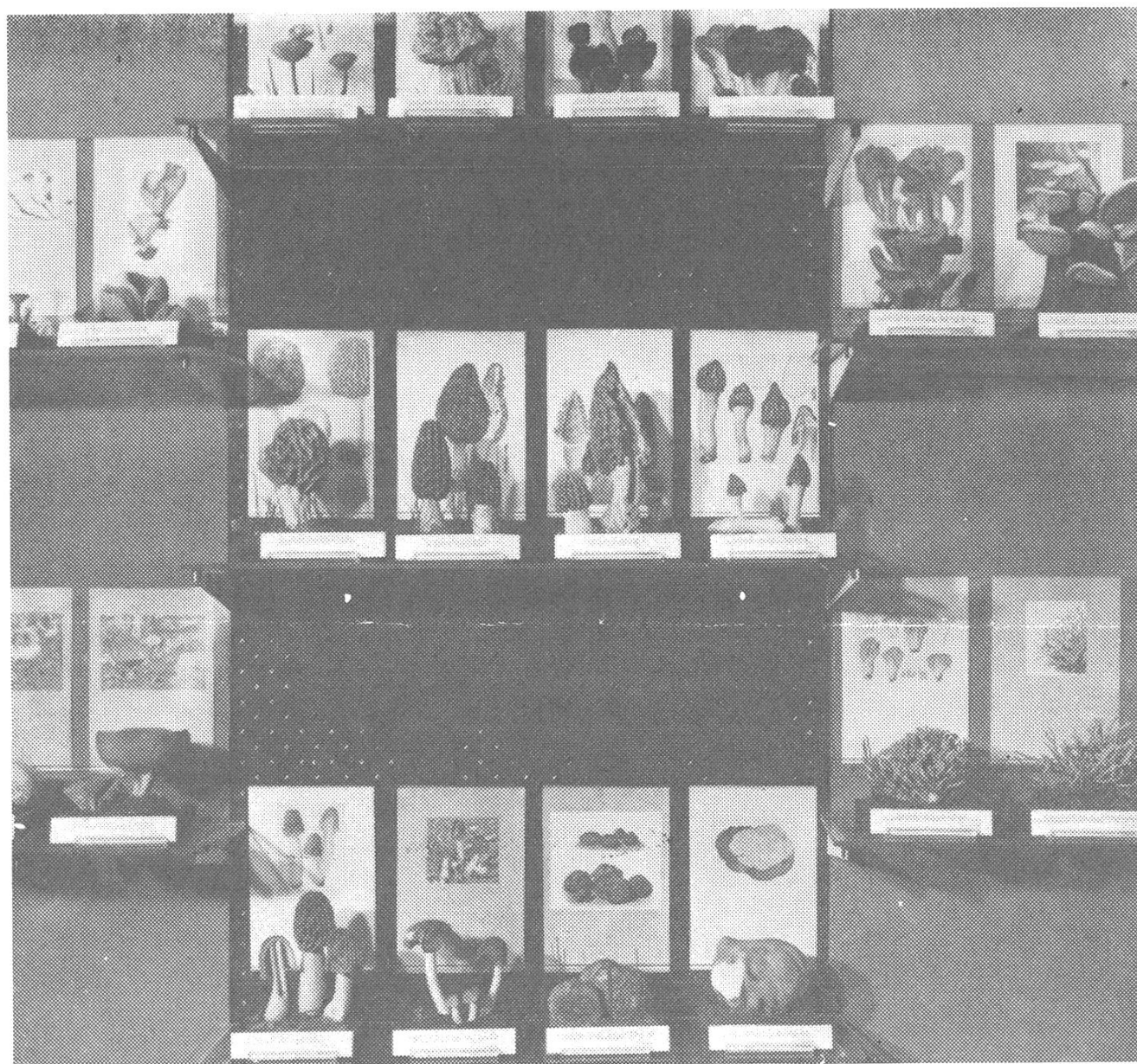
Bildausschnitt aus der «Übersicht der Pilze» mit Rulišks Holzmodellen und mit Abbildungen der betreffenden Pilzarten, auf der Dauer-Ausstellung «Houby (Pilze)/Fungi».

(Čas. Morav. Mus. / Acte musei Moraviae / Vědi přír. / Sci. natur. / 61, 1977 / 1976.)