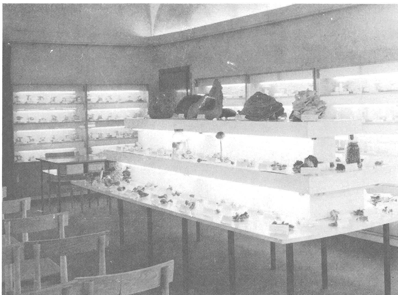
Blick in den Eingangsraum der Pilzberatungsstelle des Mährischen Museums, im Februar 1976.

In beiden Räumen der Pilzberatungsstelle werden regelmässig für Hochschulstudierende Unterrichtsstunden in Mykologie abgehalten. Zu Konsultationen kommen ausserdem jährlich Diplomanden der Brünner Hochschulen und Mittelschüler, die sich mit mykologischen Themen an der sogenannten «Biologischen Olympiade» beteiligen: sie alle finden hier Werke und Sonderdrucke der Pilzliteratur, welche ihnen sonst nicht zur Verfügung stünden, ebenso wie anderes Studienmaterial.