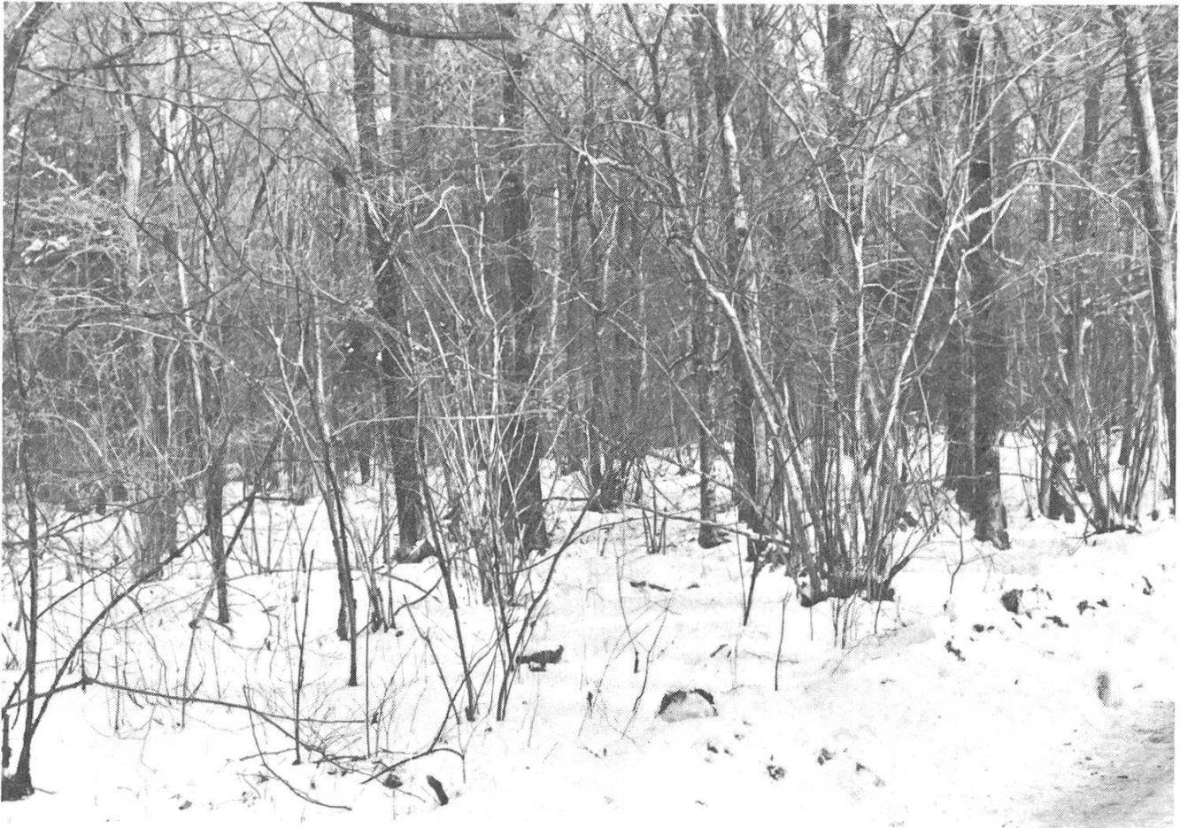
Abb. 2. Hartholzau. Man beachte den Sträucherreichtum und die vielen dünnstämmigen Bäume.