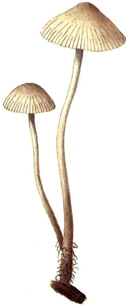
Mycena alnetorum J. Favre