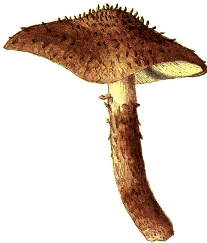
Lepiota calcicola Knudsen