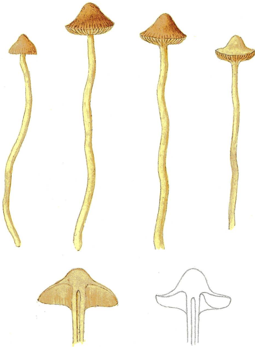
Galerina gibbosa J. Favre