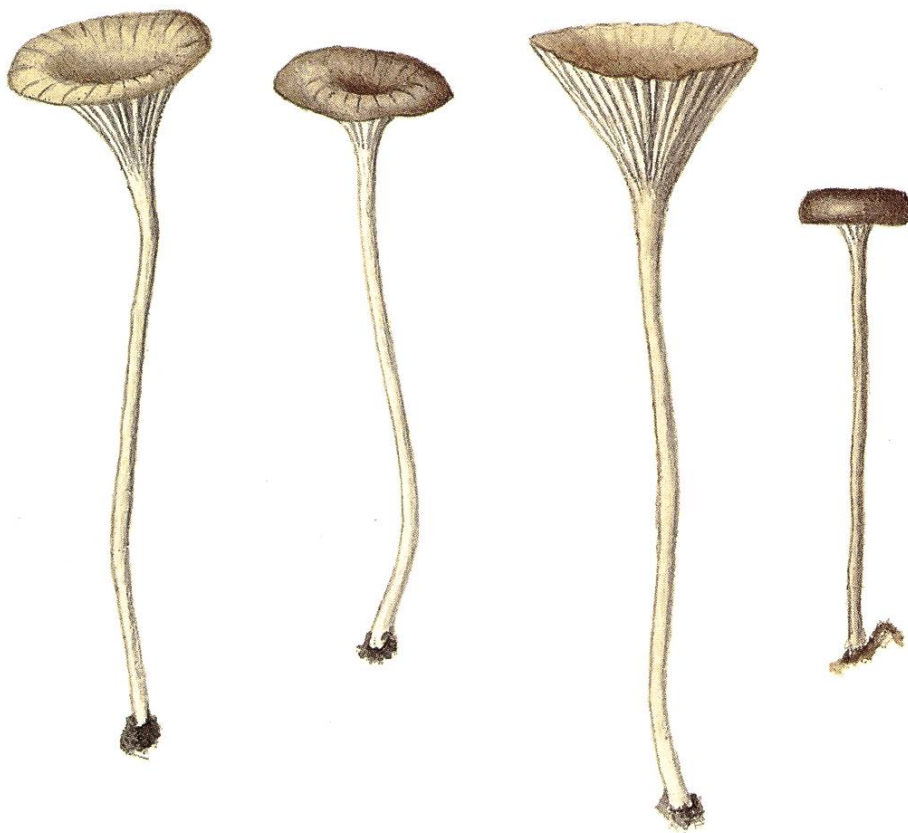
Omphalina cyathella (Favre & Schweers) Moser