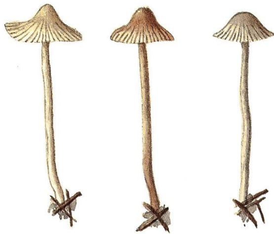
Mycena rapiolens J. Favre

Conservatoire botanique de Genève: Collection Jules Favre