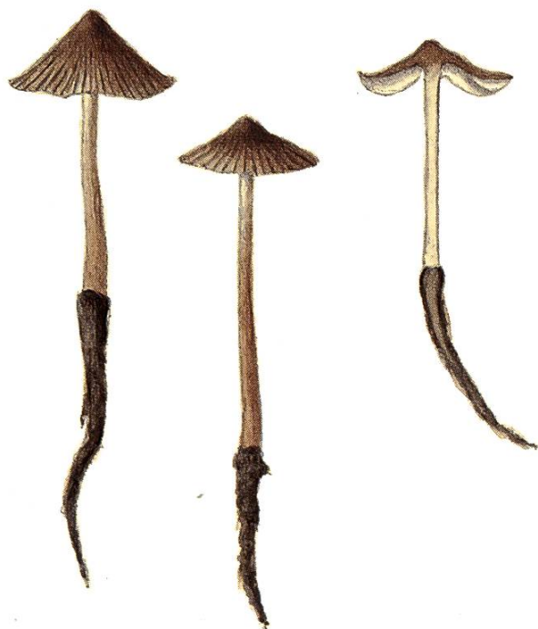
Mycena radiciper J. Favre