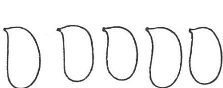
Sporen \times 1500

Pied: 2,5–5 × 4–8 mm, fistuleux, plus ou moins cylindrique et arqué, concolore au chapeau; base jaunâtre clair, parfois atténuée, rarement presque clavée.