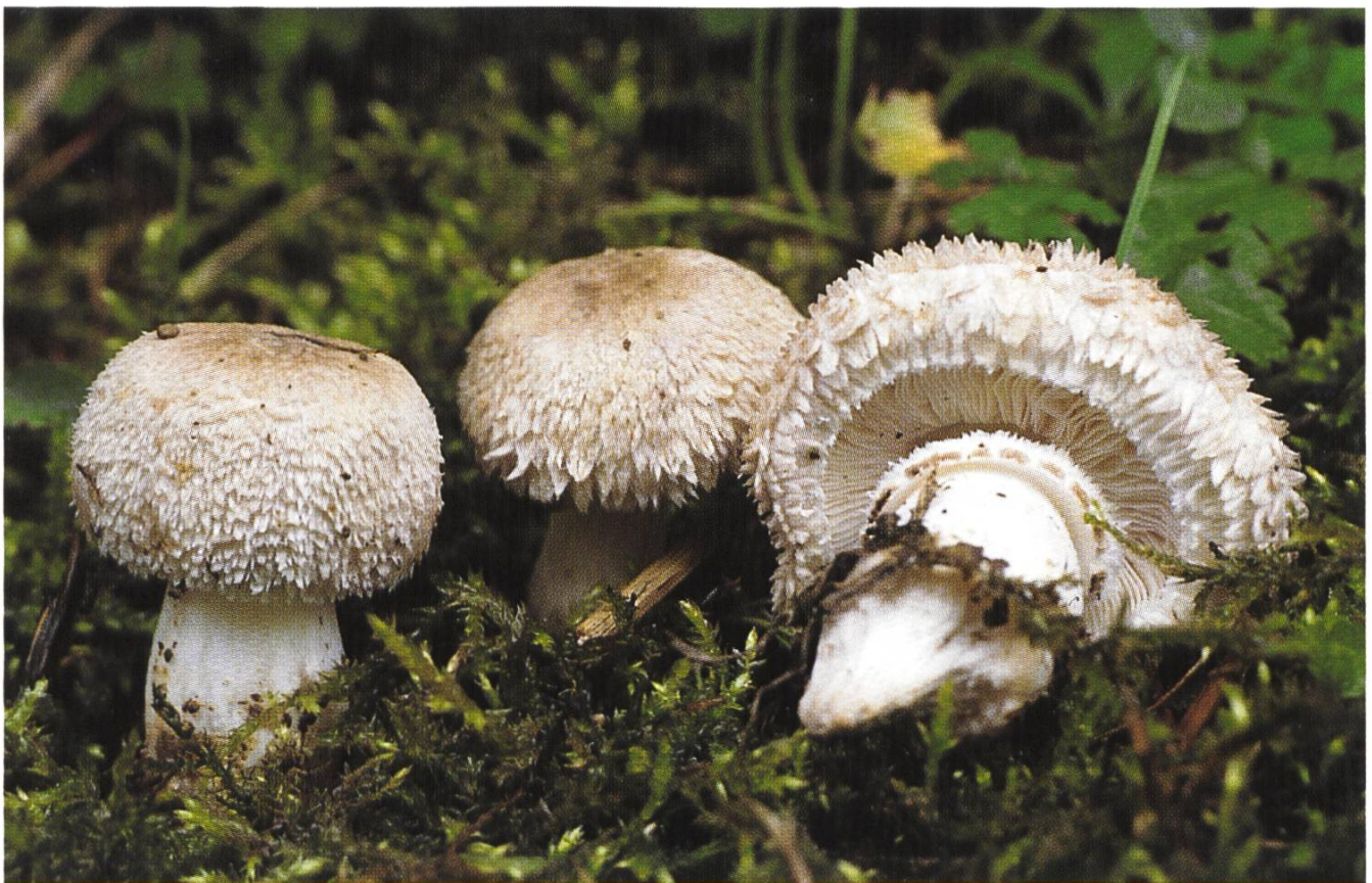
oben/en haut/in alto: Leucoagaricus macrorhizus var. macrorhizus unten/en bas/in basso: Leucoagaricus macrorhizus var. pinguipes