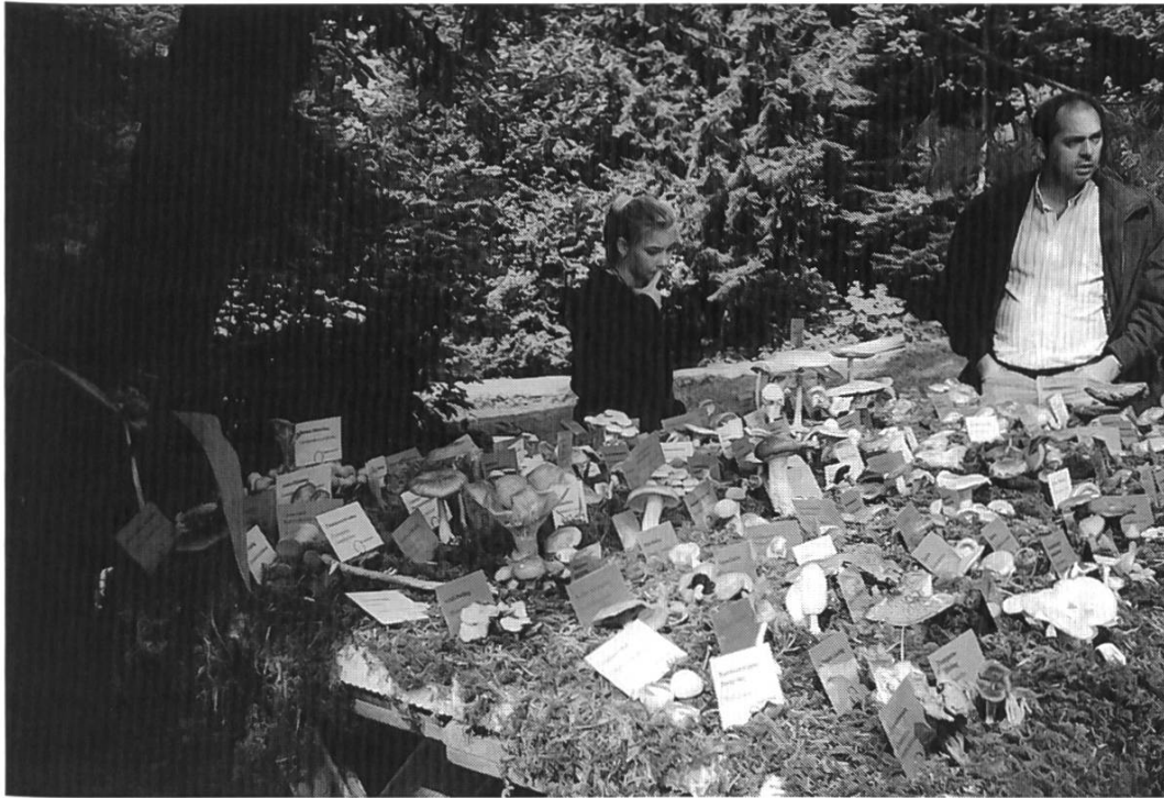
Hervorragend aufgemachte Pilzausstellung.