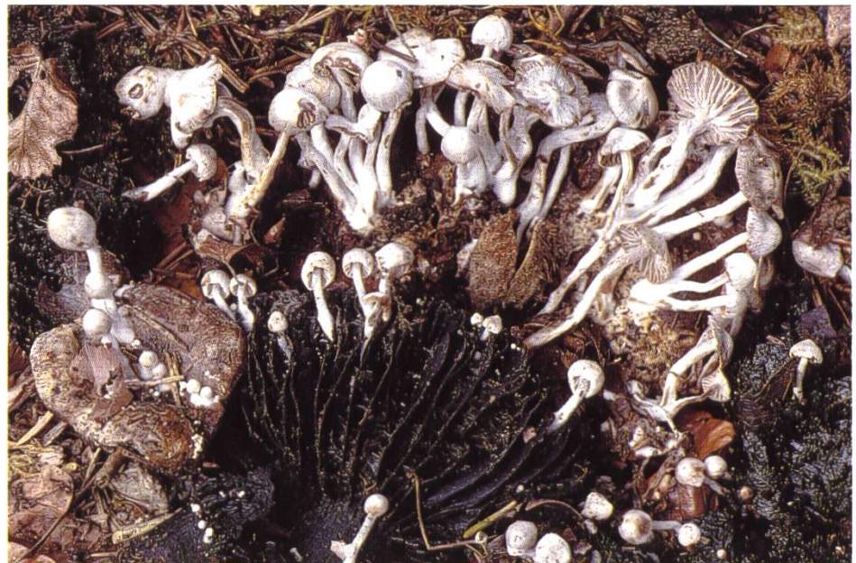
Nyctalis parasitica , Parasitischer Zwitterling