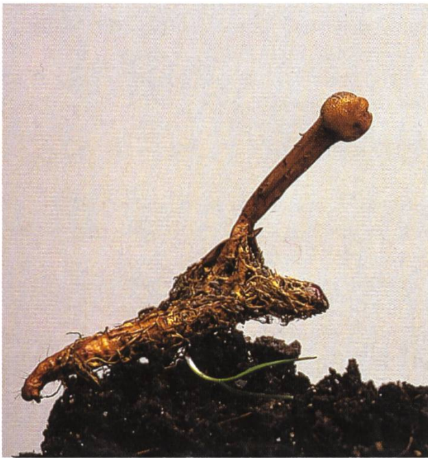
Cordyceps gracilis , Raupenkernkeule