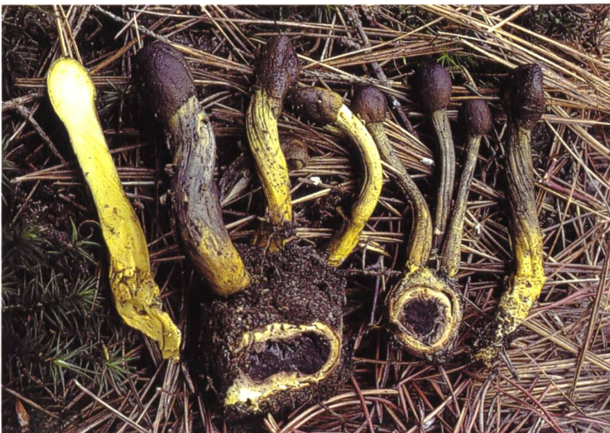
Cordyceps capitata , Kopfige Kernkeule