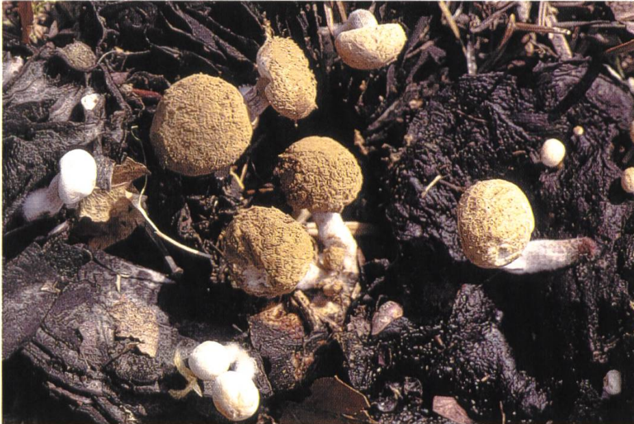
Nyctalis asterophora , Stäubender Zwitterling