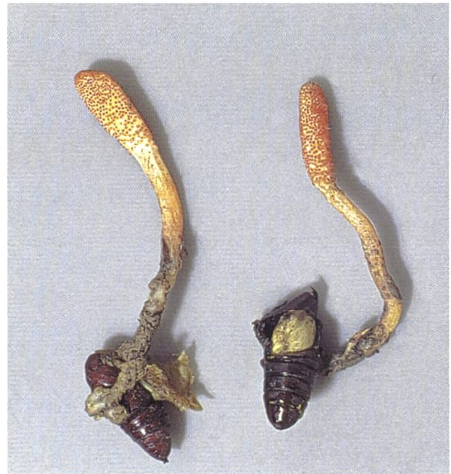
Cordyceps militaris , Puppenkernkeule