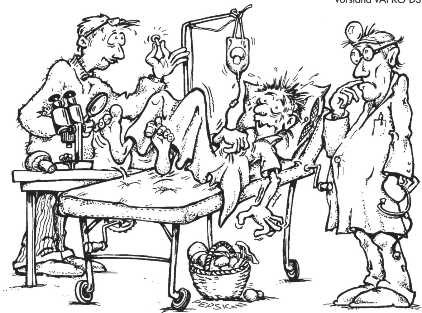
Illustration: Peter Dändliker, Küssnacht