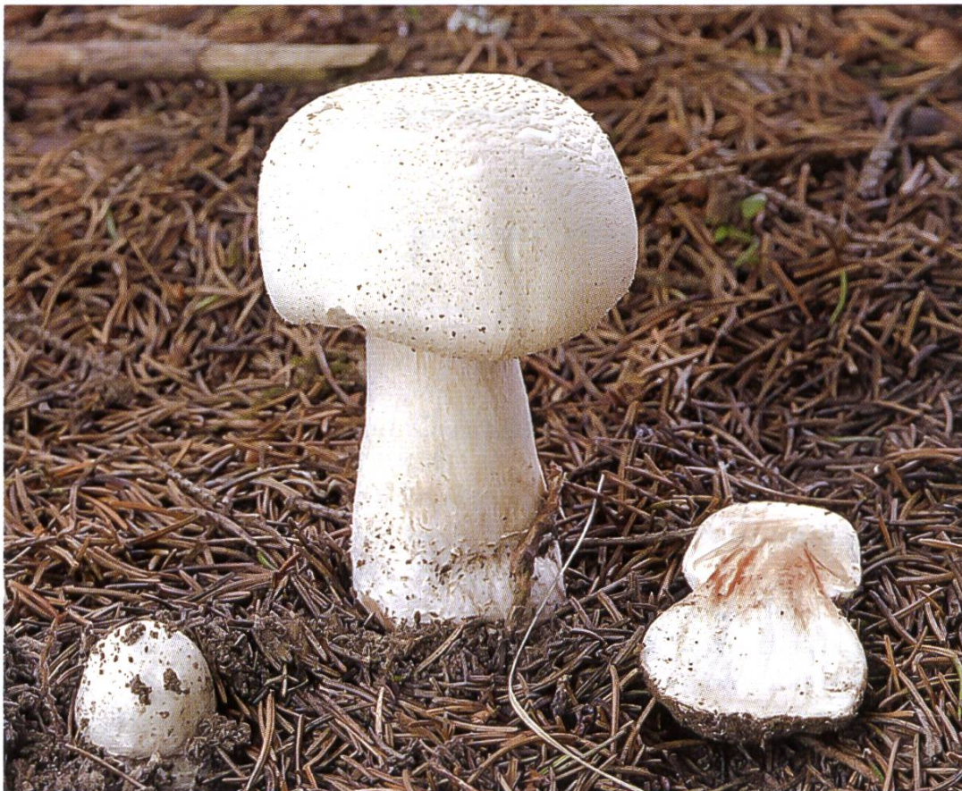
Agaricus squamuliferus , Feinschuppiger Egerling.