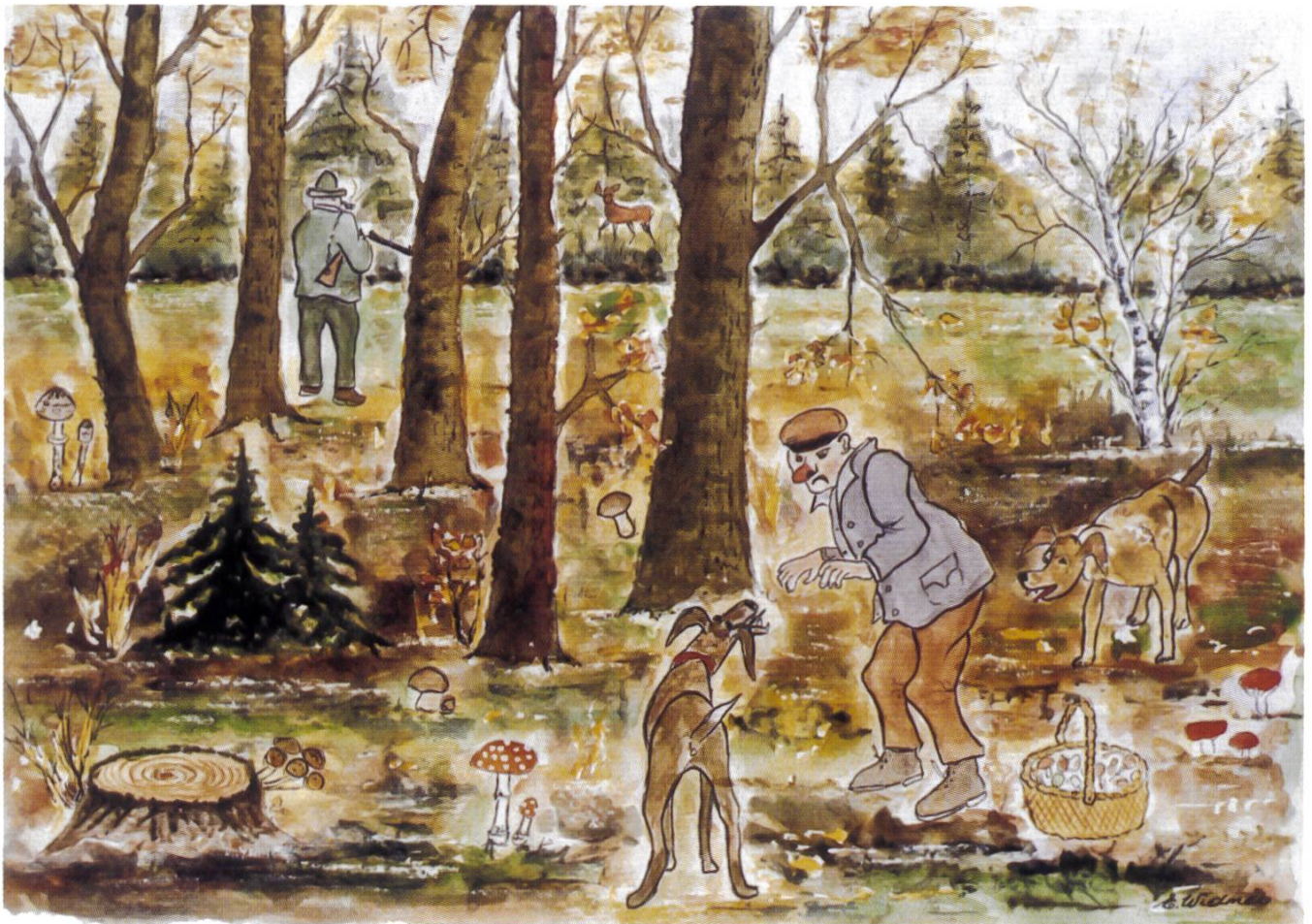
Erwin Widmer: Bänz – Freud und Leid im Wald (4) / Plaisir et surprises en forêt (4)