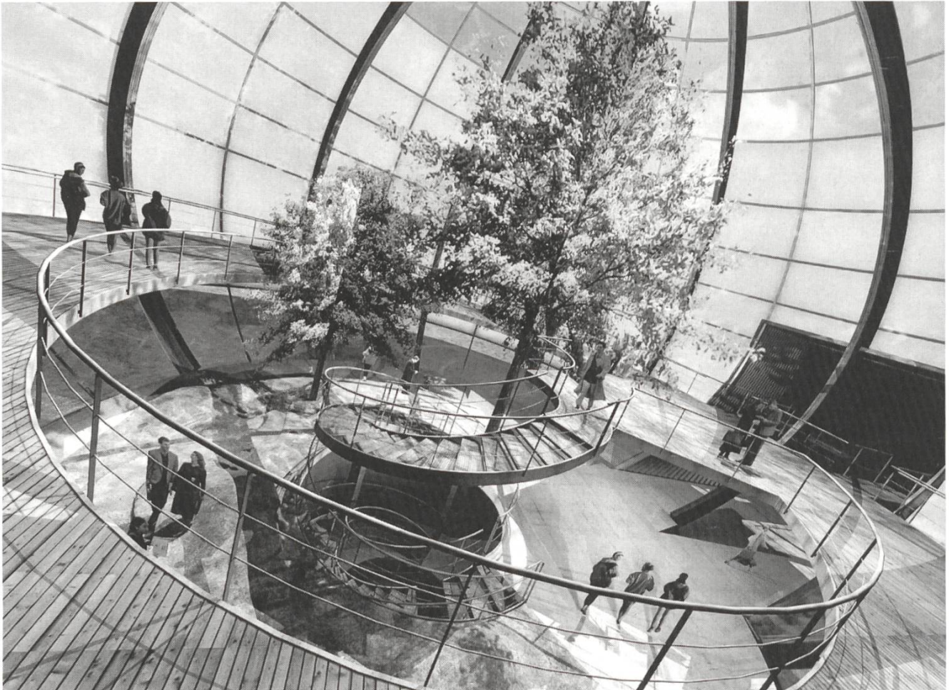
La grande bulle vue de l'intérieur. Blick ins Innere der grossen Kuppel.