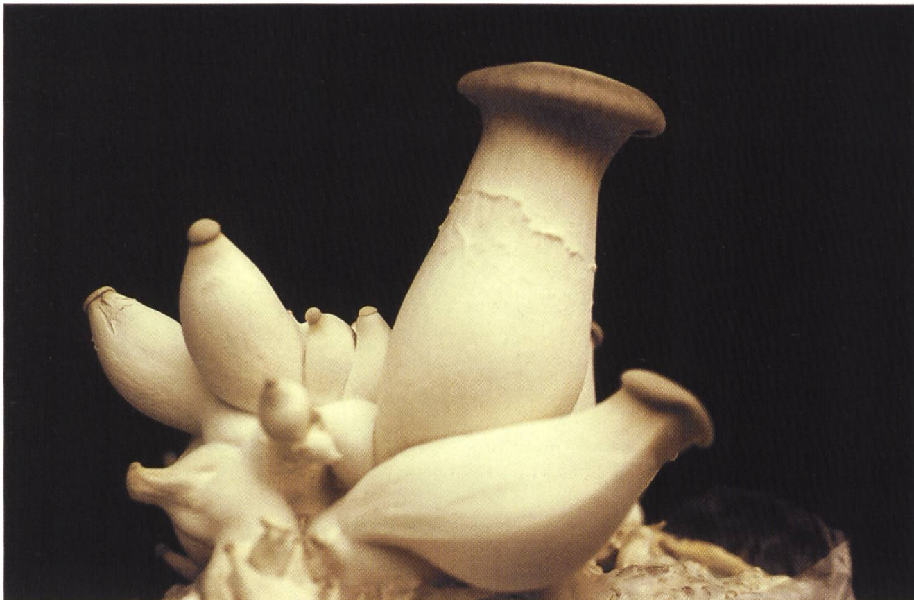
Pleurotus eryngii , Kräuterseitling