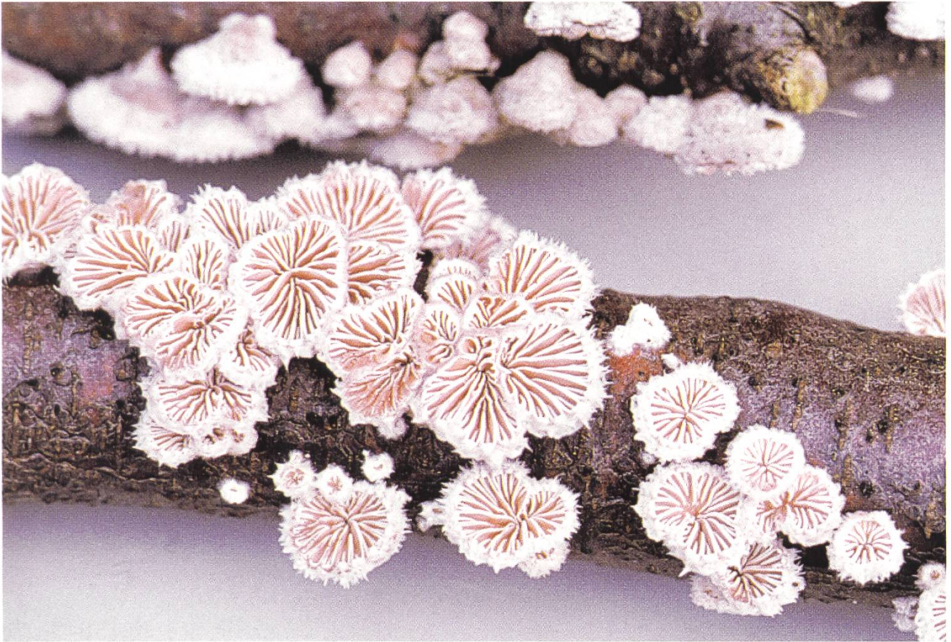
Schizophyllum commune , Spaltblättling.