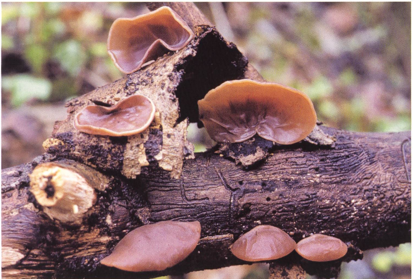
Auricularia auricula-judae , Judasohr.