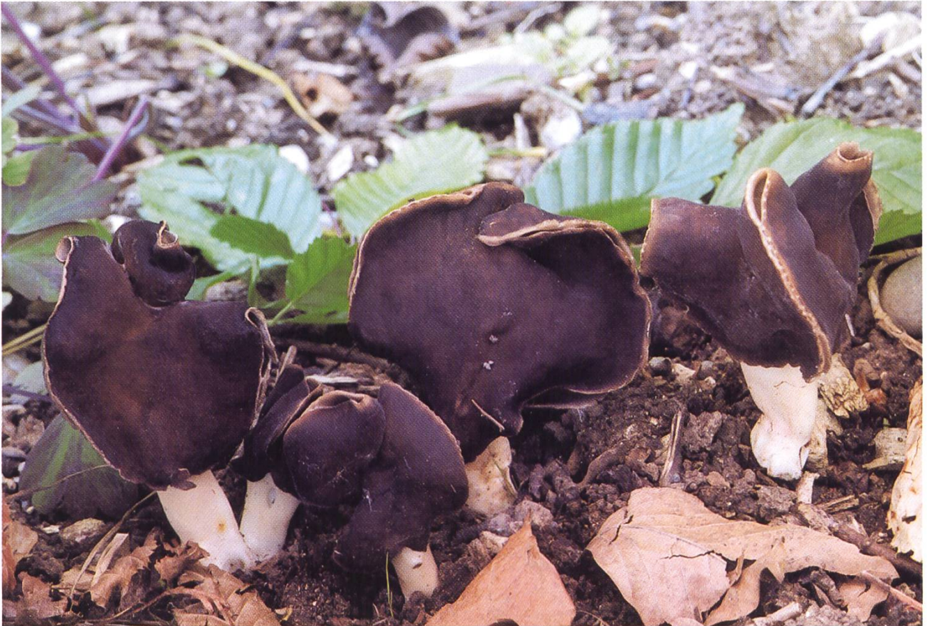
Helvella spadicea , Weissstielige Lorchel

Der Starkriechende Rötling Entoloma nausiosme , ein Vertreter der Untergattung Entoloma , ist ein eher unscheinbarer Rötling mit graubrauner Hutfarbe, der jedoch durch seinen ganz besonderen Geruch auffällt: Er riecht extrem stark nach verbranntem Gummi resp. verbranntem Fleisch mit Maggi-Komponente. Die Art wurde erst in den 80er Jahren beschrieben und dürfte zerstreut in der ganzen Schweiz zu finden sein, in Auenwäldern oder feuchten Wiesen der Bergstufe.