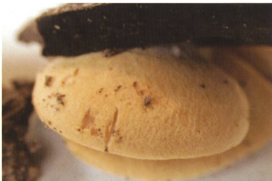
Crepidotus ehrendorferi , Bleiches Stummelfüsschen