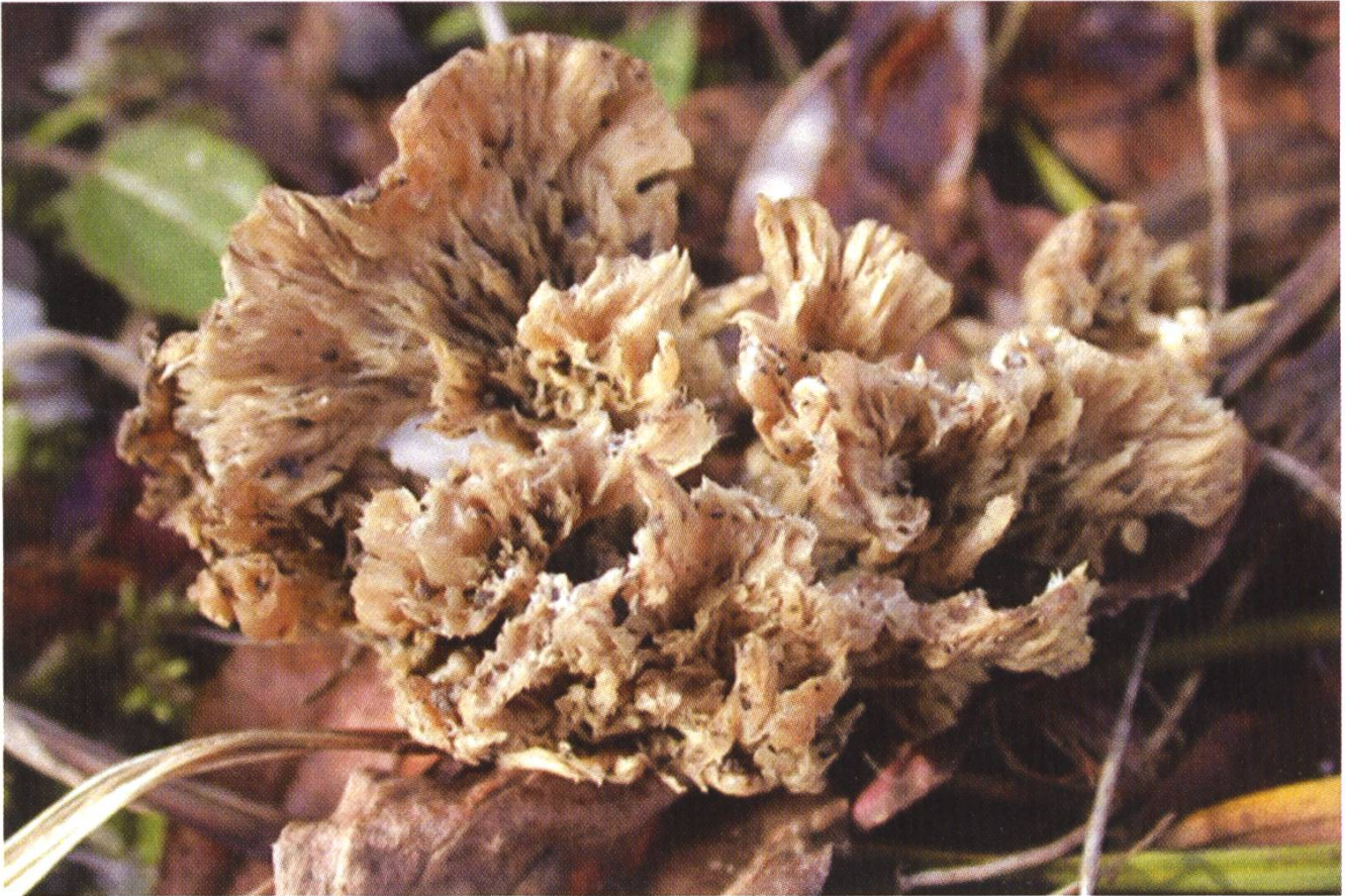
Podoscypha multizonata , Gezonter Büschelwärzling