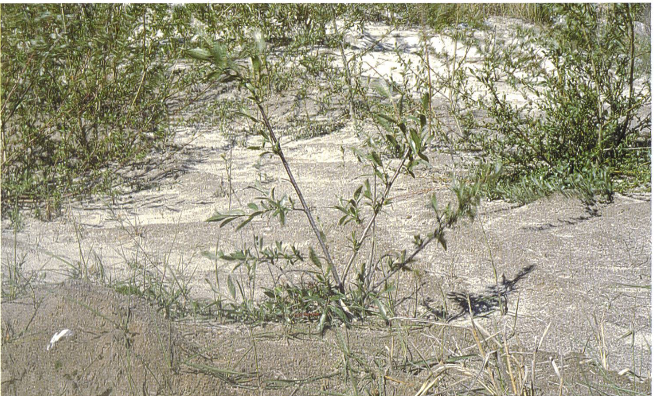
Standort und Lebensraum von Psathyrella dunarum .