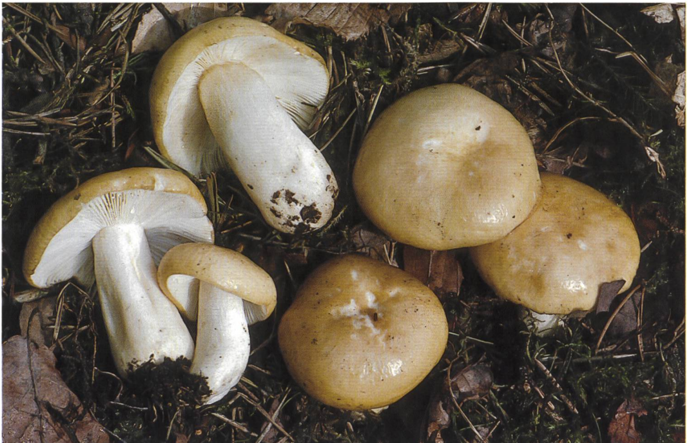
Russula ochroleuca , Zitronentäubling