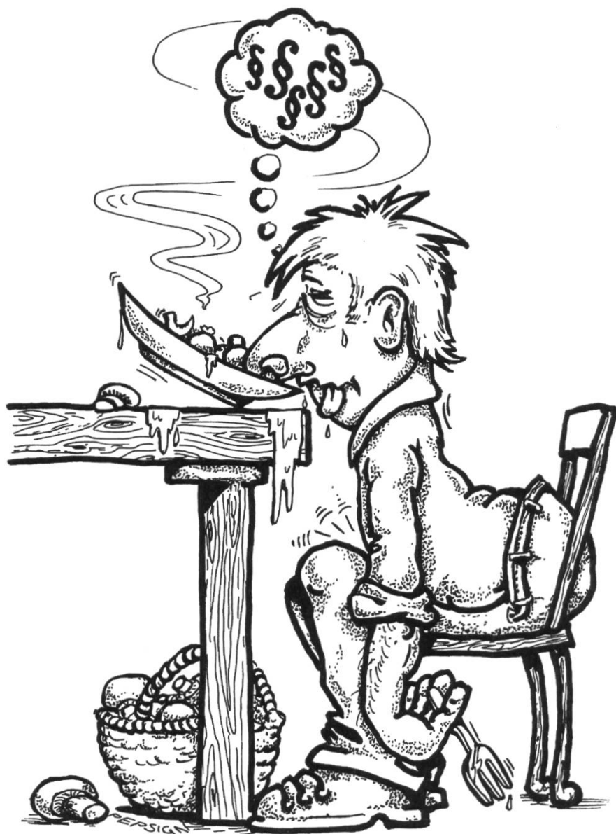
Illustration: Peps Dändliker, Küsnacht

Es ist somit nicht nur kurzfristig, sondern gefährlich zu glauben, auf die Kontrolle privaten Sammelgutes könne verzichtet werden. Gerade in der heutigen Zeit stünde es dem Staat gut an, zur Vermeidung unnötiger Gesundheitskosten die Pilzkontrollstellen aufrechtzuerhalten. Im Zuge pauschaler Spar- und Rationalisierungsmassnahmen Bewährtes über Bord werfen mag zwar modern sein, aber ist es auch immer sinnvoll? Aus der Sicht des Arztes, der Versicherung und vor allem für die Betroffenen ist das sicher nicht der Fall.