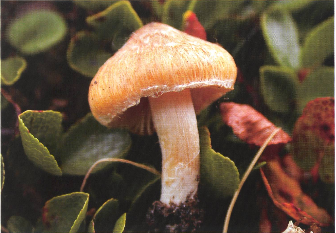
Fig. 1: Inocybe aurea – Standortfoto / Photo de la station