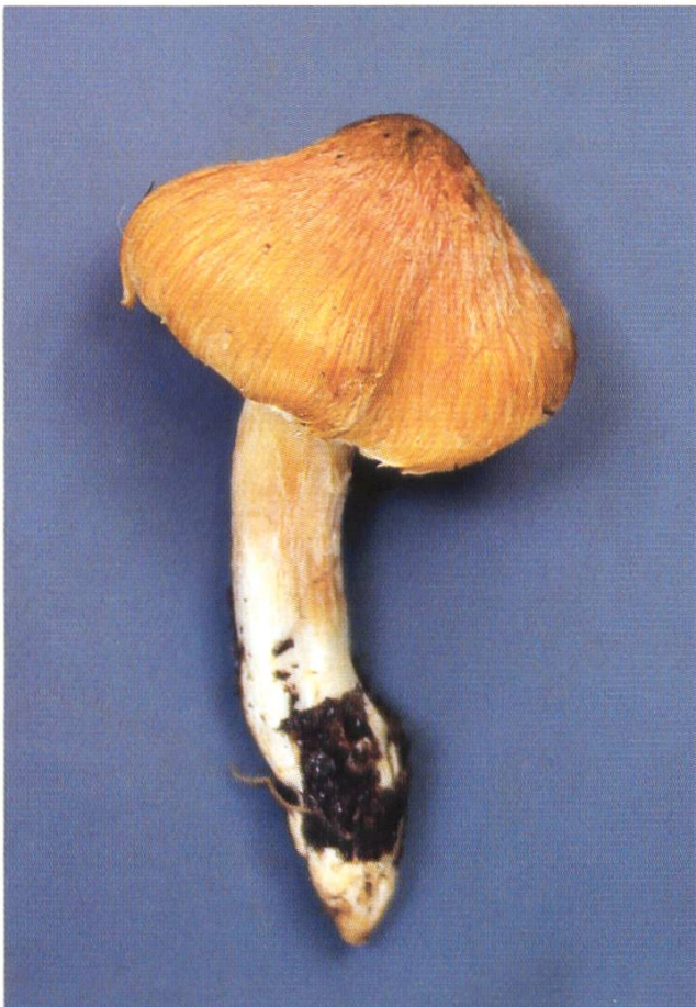
Fig. 2: Inocybe aurea – Studioaufnahme / Photo en laboratoire