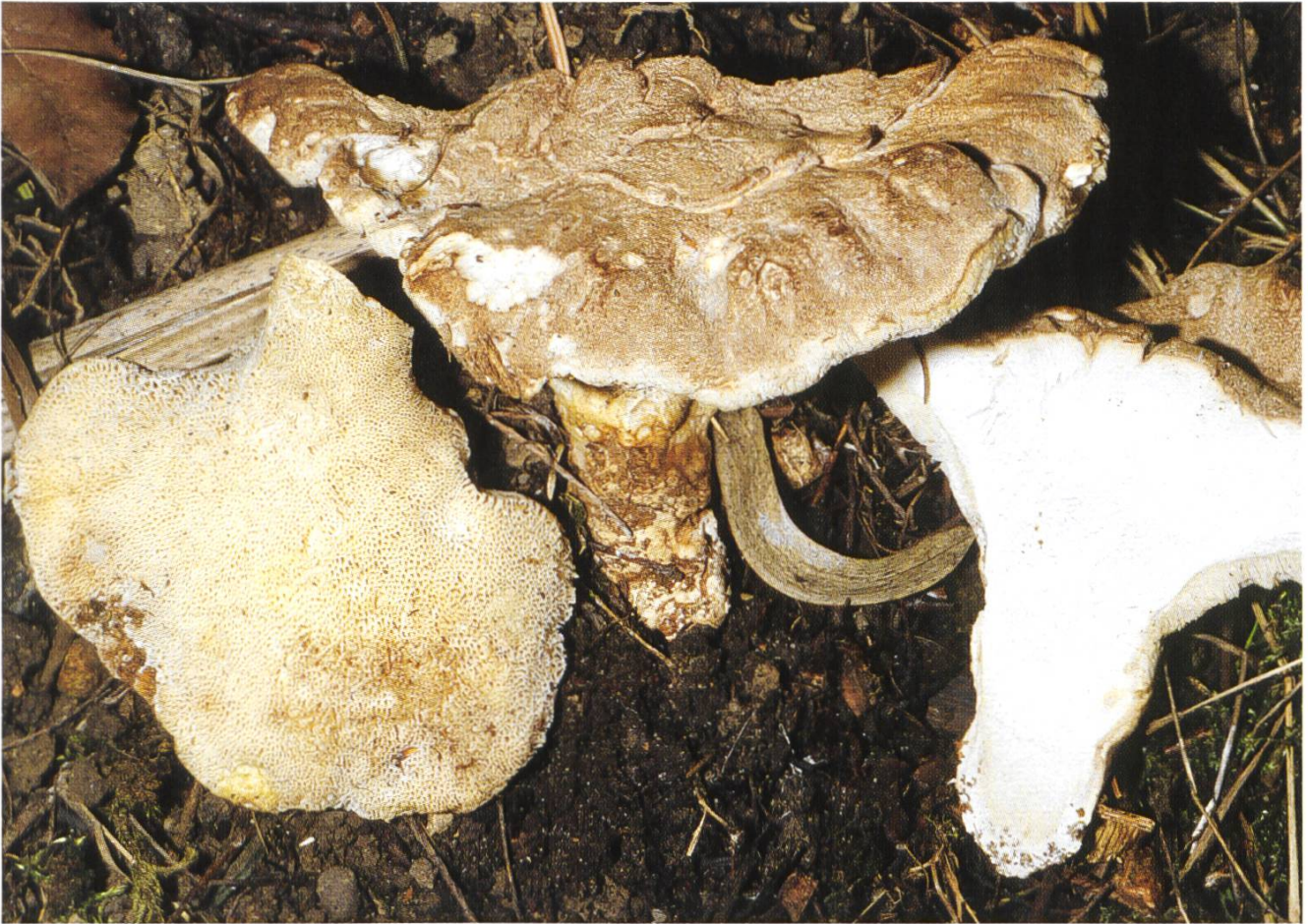
Jahnoporus hirtus , Brauner Haarstielporling