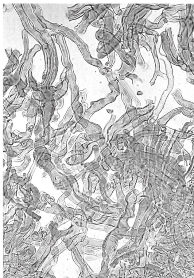
Hyphen Context / hyphes de la chair