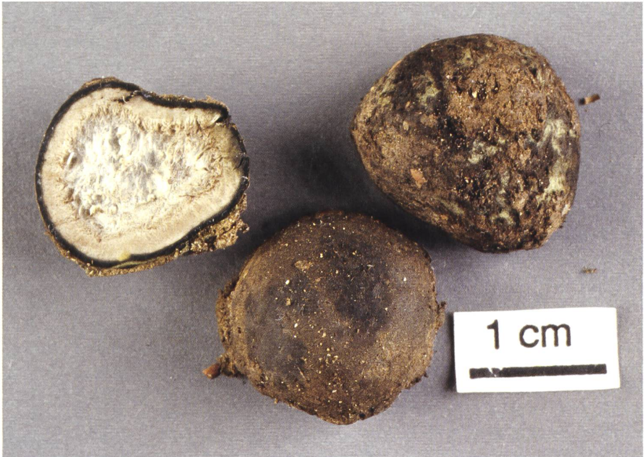
Elaphomyces maculatus , Gefleckte Hirschtrüffel