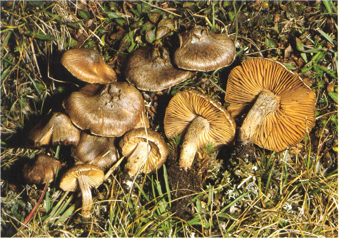
Incocybe johannae (5. 9. 1999)