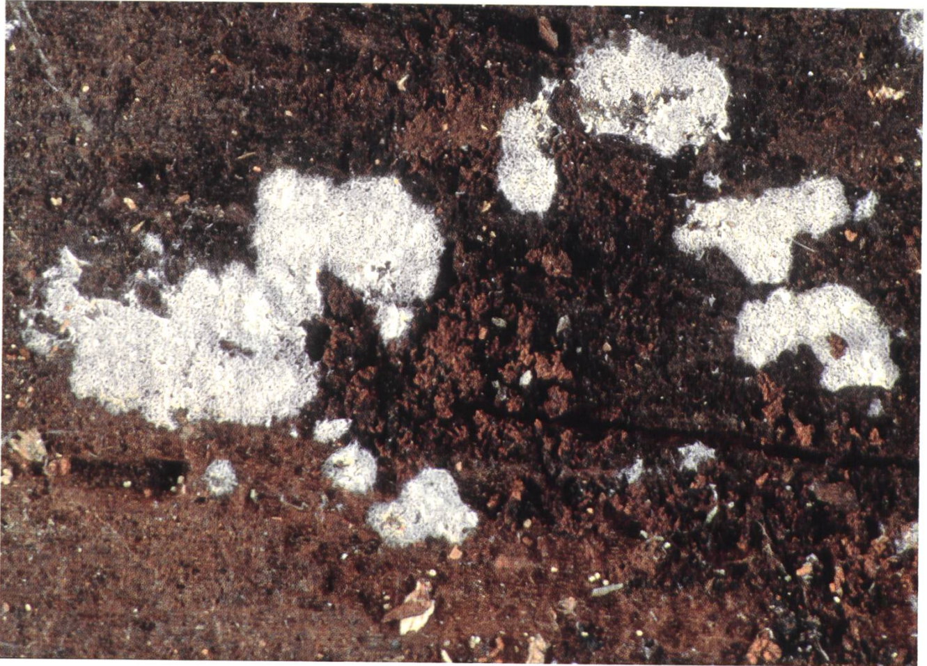
1 ± 1 mm