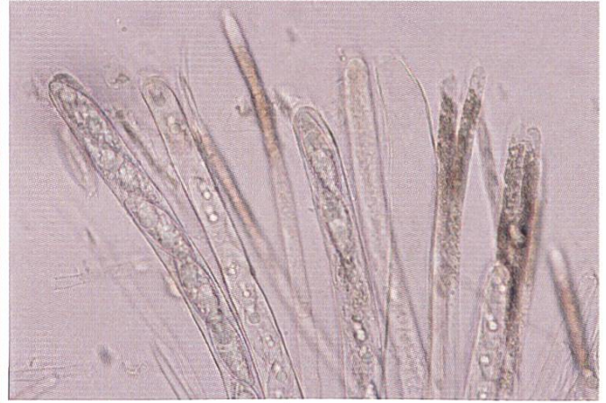
Fig. 3 Paraphyses / Paraphysen