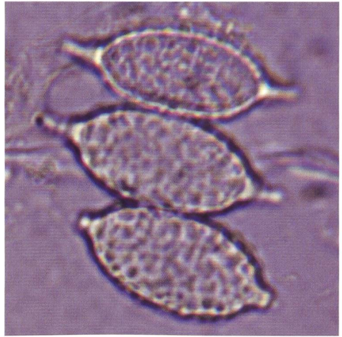
Sporen in H 2 O | Spores dans H 2 O