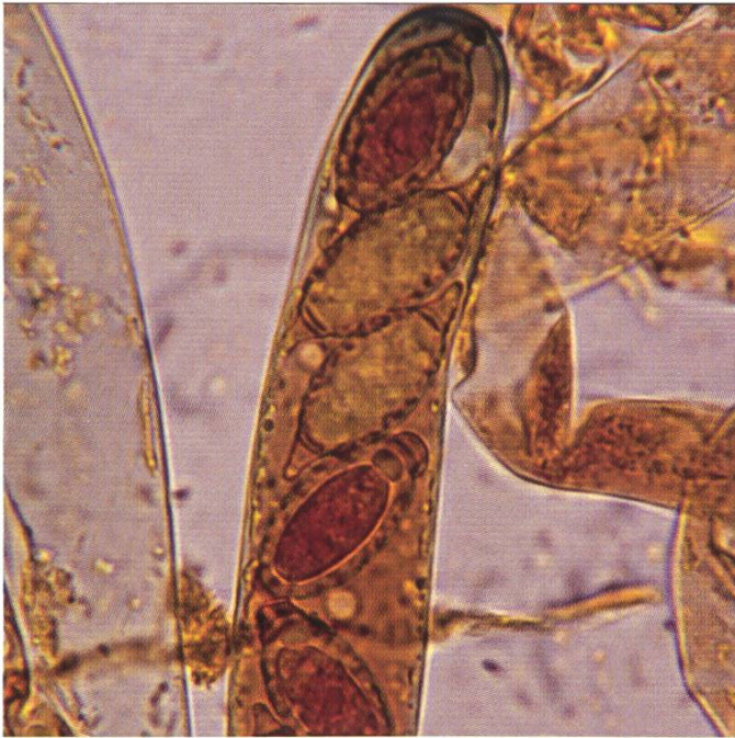
Ascus in Melzer mit Sporen | Asques dans Melzer avec spores