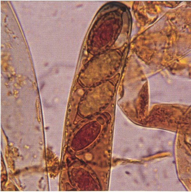
Ascus in Melzer mit Sporen | Asques dans Melzer avec spores