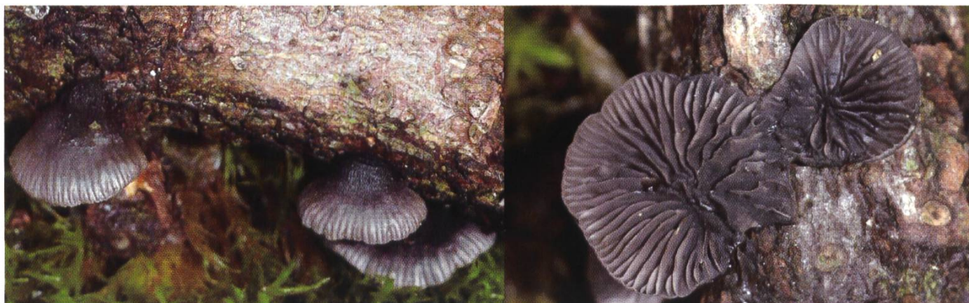
Hohenbuehelia pinacearum auf Weisstanne | H. pinacearum sur sapin blanc

Weitere Funde am 16. April 2005 (Ueli Graf) und 16. Oktober 2005 (Julius Stalder) im Umkreis von 50 Metern. Exsikkate im Naturmuseum Luzern.