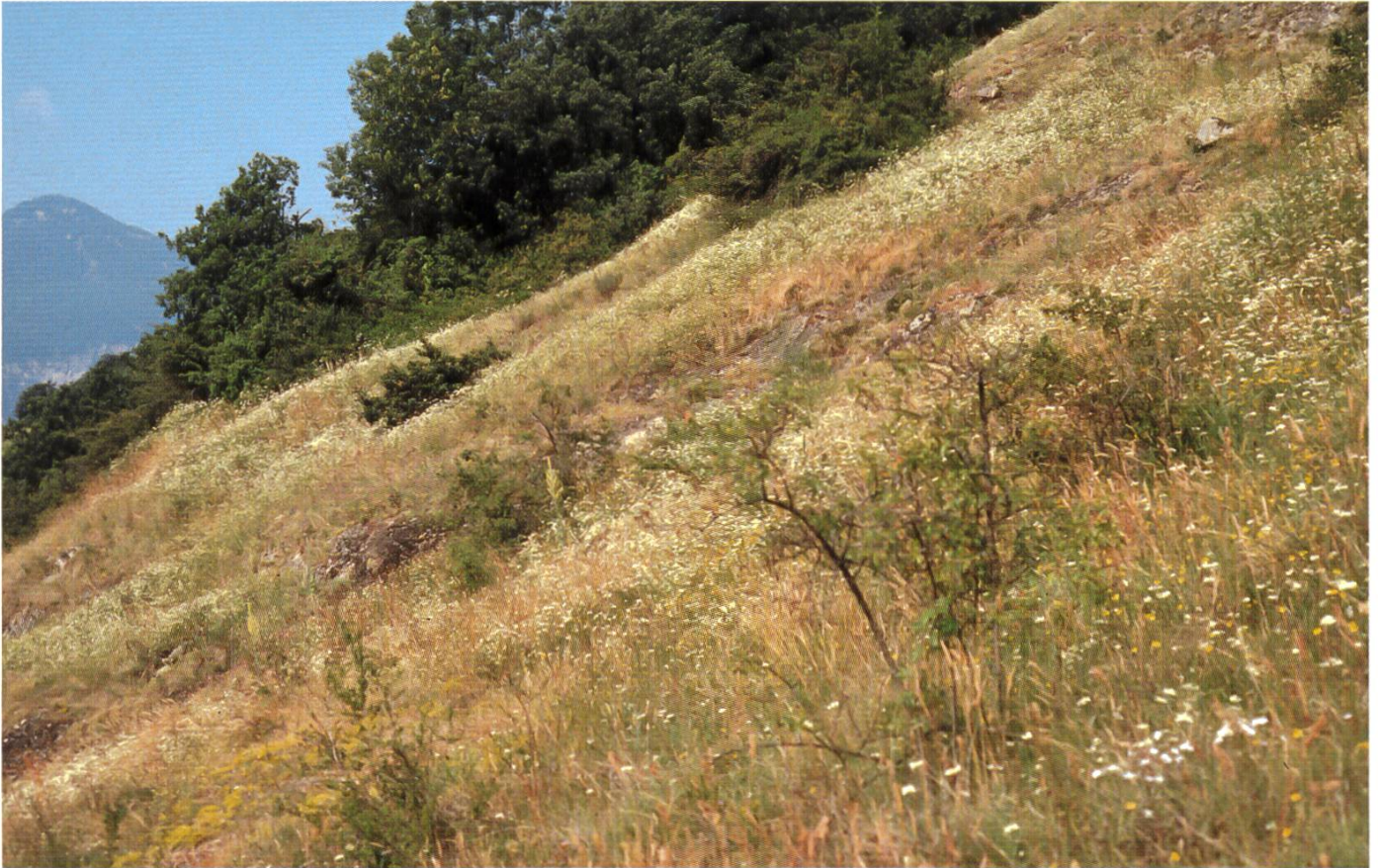
Foto 2 Habitat Felsensteppe | Habitat pelouse steppique (Follatères VS)

Um Sicherheit zu erreichen, wurde der bei Jülich (1984) zitierte Artikel zu dieser Art in der tschechischen Pilzzeitschrift konsultiert. In einer weiteren Exkursion wurde die nähere Umgebung der Fundstelle minutiös nach weiteren Fruchtkörpern abgesucht. Nur an der gleichen Stelle wurden in