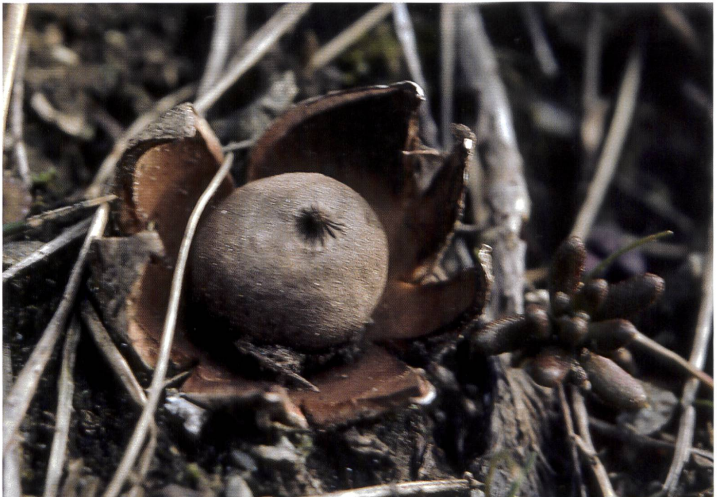
Foto 1 Frischer, junger Fruchtkörper am Standort | Jeune fructification fraîche sur la station

Nun kann die Suche nach einem Artnamen erneut beginnen! Mit den neuen Daten ist unser Pilz dann als Geastrum pouzarii bestimmbar.