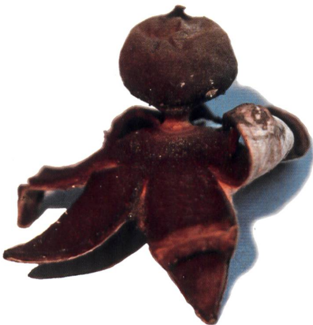
Foto 3 Derselbe Fruchtkörper zwei Wochen später, nachgereift. | La même fructification, deux semaines plus tard, après la maturité.