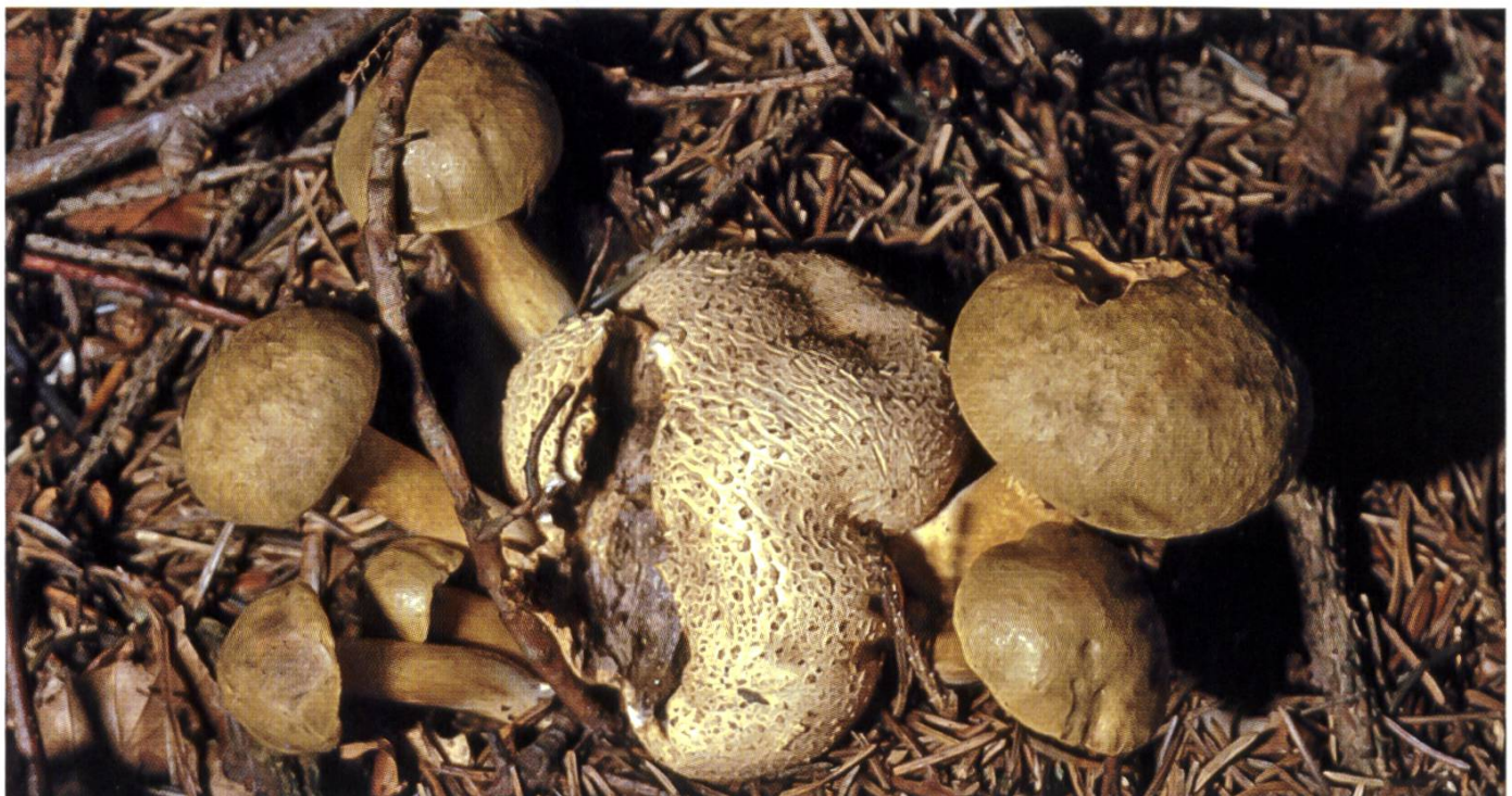
Xerocomus parasiticus auf Scleroderma citrinum