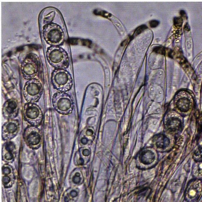
Tav. 2 Parafisi e aschi in diversi stadi di maturazione, contenenti 8 o 4 spore e spore quasi fagocitate | Paraphyses et asques à des degrés divers de maturité, contenant 8 ou 4 ascospores et des ascospores presque phagocytées

Ornamentazione > Cianofila, costituita da verruche a sommità arrotondata, di altezza fino a 1,2 µm, isolate, a volte allungate e formanti creste corte oppure costituita da 2–3 verruche concatenate (Tav. 4, fig. 2a).