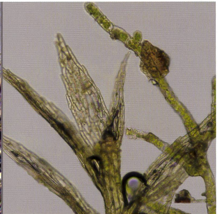
Tav. 3 Protonema (primo stadio del muschio) e giovane muschio. | Protonéma (filament) et jeune mousse