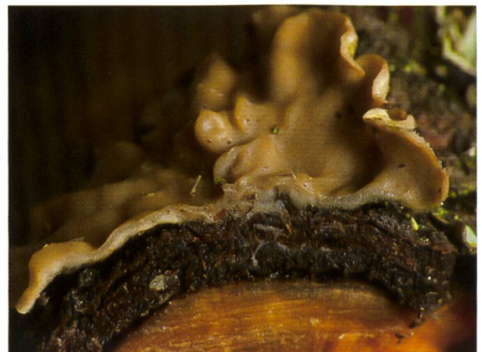
Cytdiella melzeri Schnitt durch Fruchtkörper