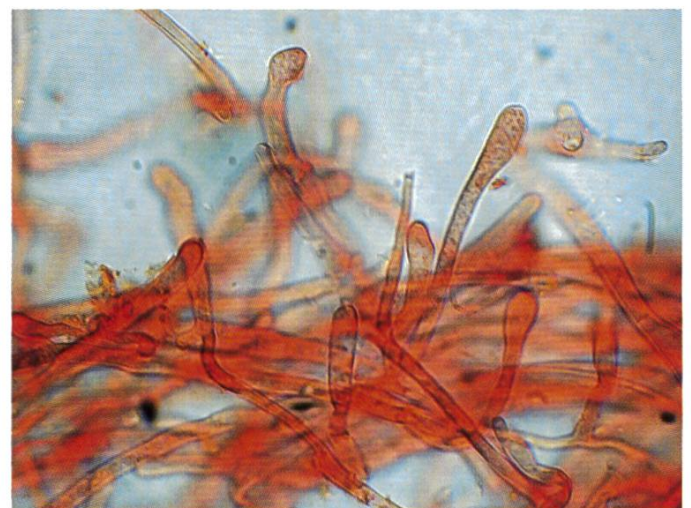
Caulocute | Kaulokutis | Caulocutis