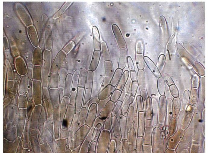
Rivestimento pileico | Hutdeckschicht | rev. piléique

Habitat: Zona collinare pianeggiante 480 m s.l.m. Bosco interno, in tratto molto umido-ombroso con ( Fraxinus-Pseudotsuga menziesii-Fagus-Quercus-Pinus ), su terreno calcareo, substrato misto argilloso-sassoso ricco di carbonati, superficie colonizzata completamente da formazioni muscose, ricoperta per larghi tratti di detriti legnosi molto degradati. Rinvenuti circa 30 esemplari sparsi a