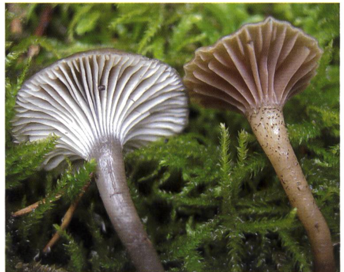
Specie a confronto – a sinistra C. atrovelutina a destra C. atropuncta | Vergleich – links C. atrovelutina , rechts C. atropuncta .

Camarophylloopsis atrovelutina ist eine sehr seltene Art, wie die vorliegenden Funde als Schweizer Erstfunde beweisen. Diese Funde in Ettingen (Kanton Basel-Landschaft), in einem hügeligen, feucht-nassen Waldgebiet auf kalkreichem Boden belegen die Vorliebe der Gattung Camarophylloopsis für solche Habitate. Es wurden auch andere Arten aus der gleichen Gattung gefunden: Camarophylloopsis micacea