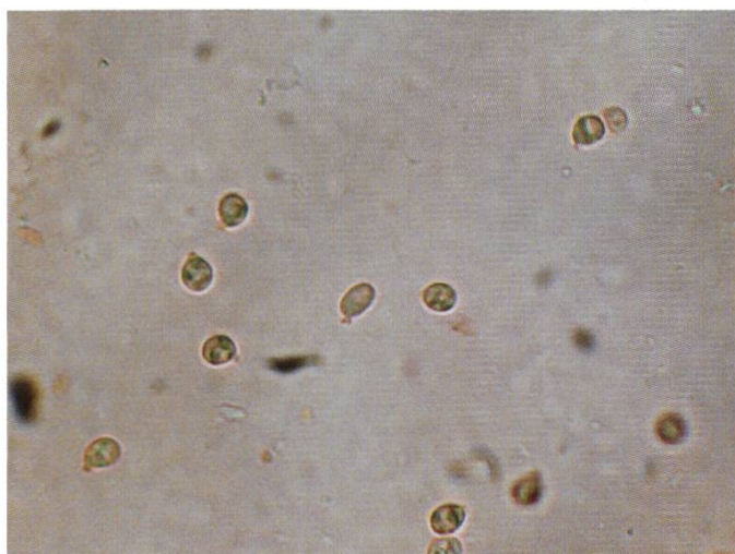
Spore | Sporen | Spores