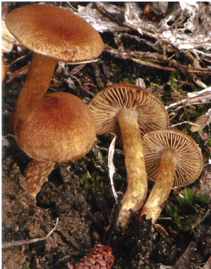
Inocybe malenconii : Corpi fruttiferi | Fruchtkörper