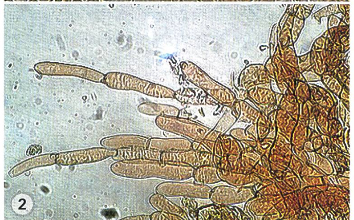
① Cheilocistidi | Cheilozystiden, ② Cuticola | Kutikula