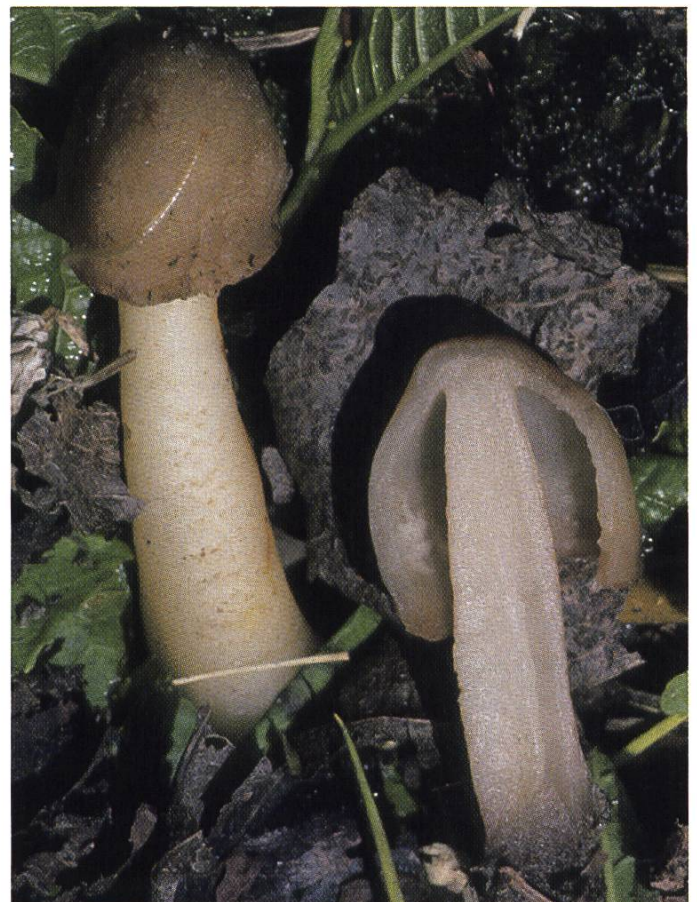
Verpa conica : Fingerhut-Verpel | Verpe conique