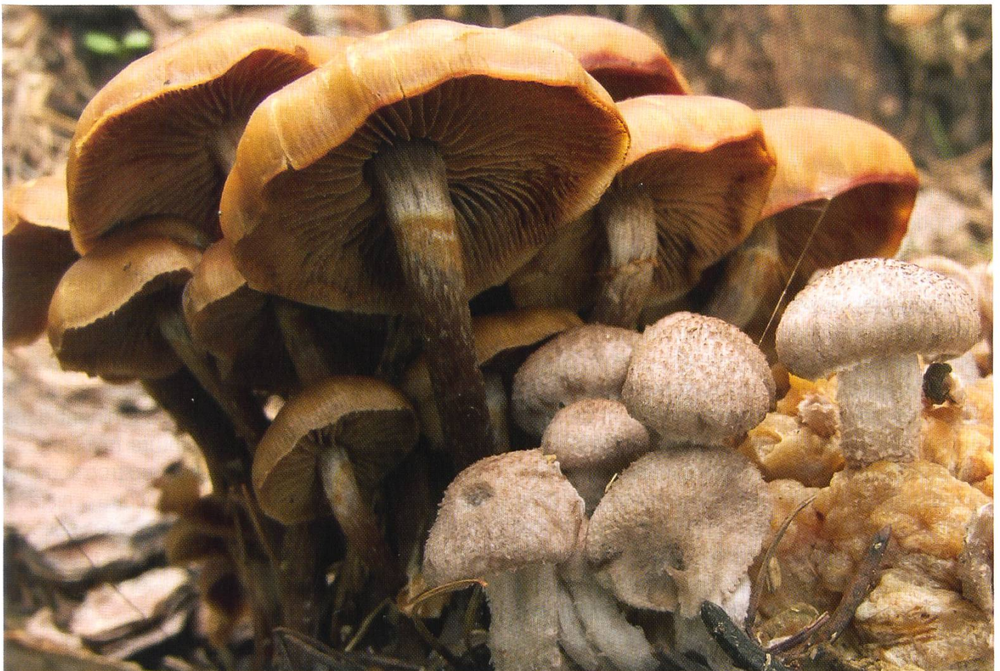
Squamanita fimbriata Corpi fruttiferi | Fruchtkörper

IMBACH E. J. 1946. Squamanita , Pilzflora des Kantons Luzern. Mitteilungen der Naturforschenden Gesellschaft Luzern 15: 5–85